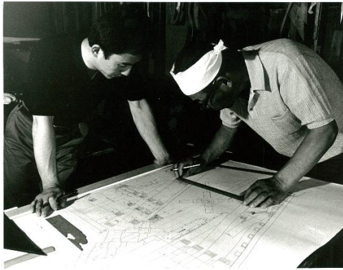
西岡棟梁より設計指導を受ける受賞者（左）