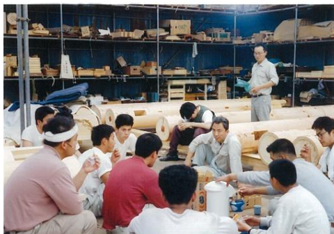
弟子と休憩の様子（中央が受賞者）