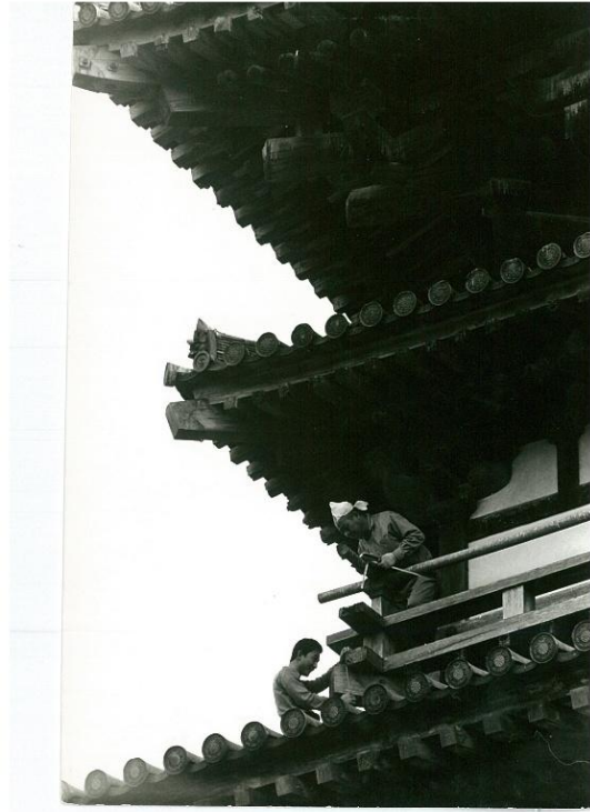
薬師寺西塔再建のため西岡棟梁と東塔を計測する受賞者（下）