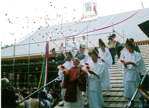
埼玉県長久寺上棟式典（先頭が受賞者）