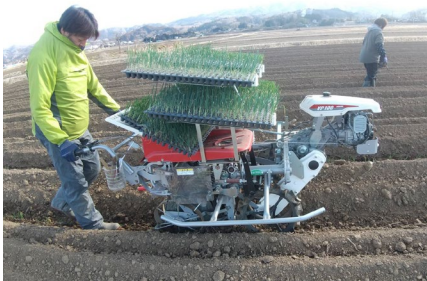
農業体験プログラムの開催