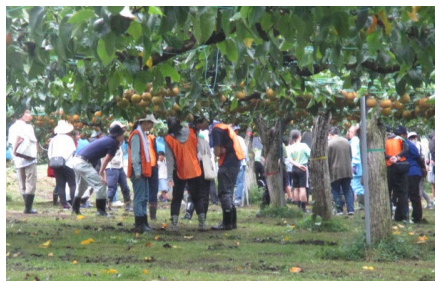
収穫祭、農協祭等のイベント開催