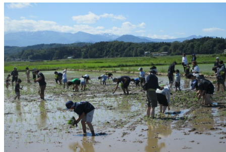
都市農村交流の開催