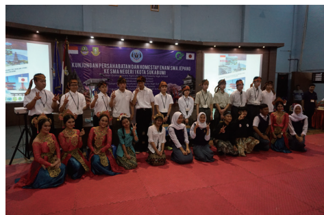
森林・林業専攻高校生国際交流事業（インドネシア）