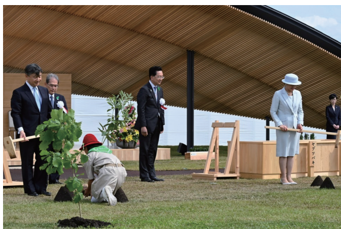
第 73 回全国植樹祭（岩手県）

両陛下は、参加者とともに苗木をお手植えになられ、また、種子をお手まきになられます。お手まきの種子は大切に育てられ、公共地の植樹に供されています。