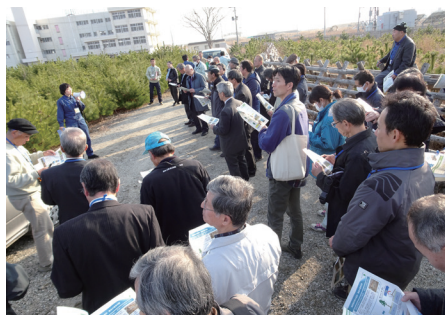
海岸防災林再生ワークショップ

造成されたファンドの運用益は、森林に親しみ森林づくりに参加していただくための普及啓発活動や、森林と水との関わりなど森林の公益的機能についての実践的な調査研究、緑化推進に関する国際交流の推進など、森林づくり運動への理解を深め、協力を得るための事業に活用しています。