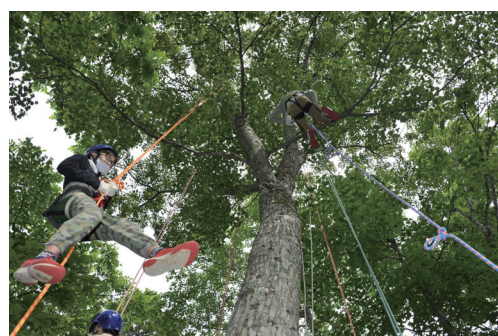
ツリークライミング体験（北海道）