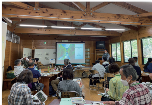
森林サービス産業現地研修