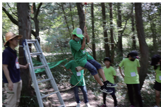
東海地区サマージャンボリー大会(三重県)

緑の少年団の育成と自主的な活動をさらに伸展させるため、全国から選出された緑の少年団による活動発表大会や交流大会、緑の少年団の指導者研修交流会などを実施しています。