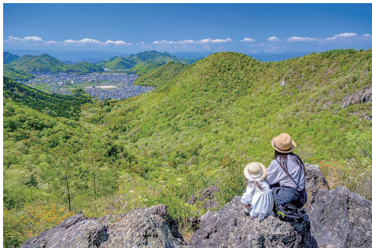
第30回みどりの感謝祭フォトコンテスト最優秀賞作品