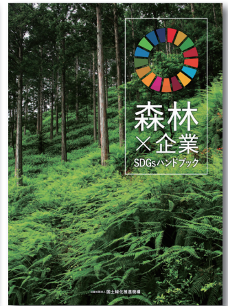
SDGsハンドブック(企業) 表紙