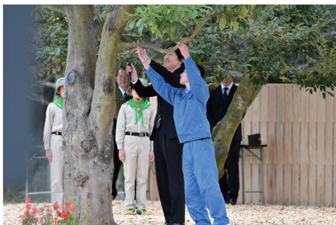
第 46 回全国育樹祭（茨城県）

全国育樹祭は、活力ある森林を育てるには十分な保護・手入れが必要であることの理解を広く普及するために、毎年秋に、皇嗣同妃両殿下のご臨席を仰ぎ開催しています。