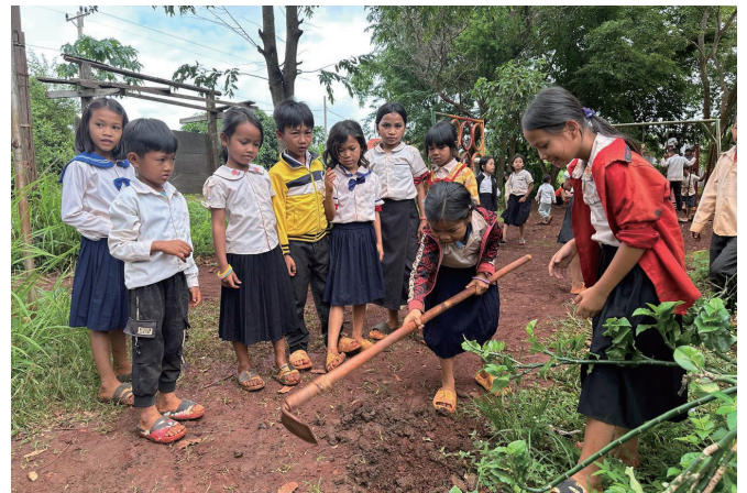
小学生による植樹（カンボジア王国）