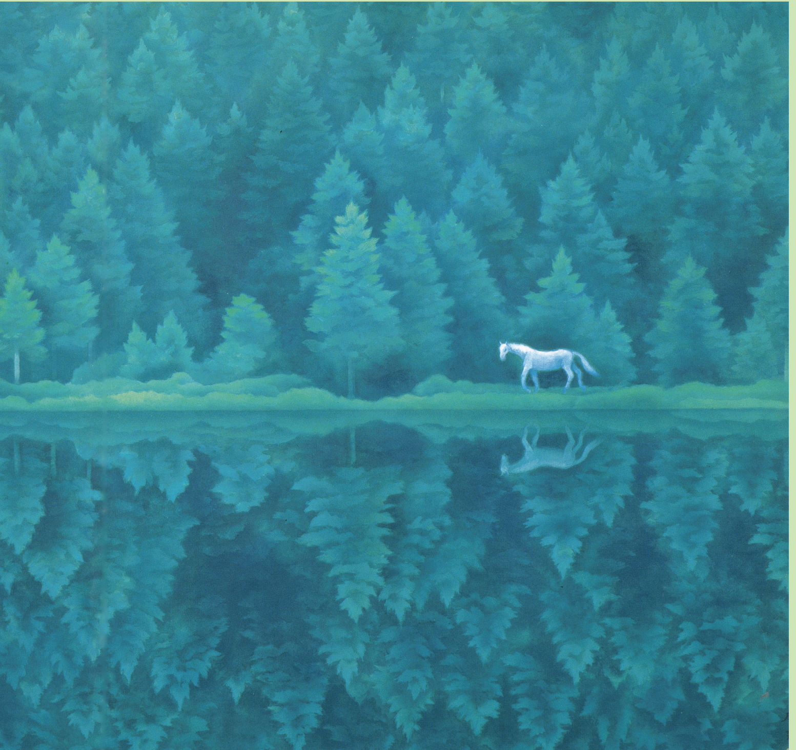
東山魁夷「緑響く」(長野県立美術館・東山魁夷館蔵)