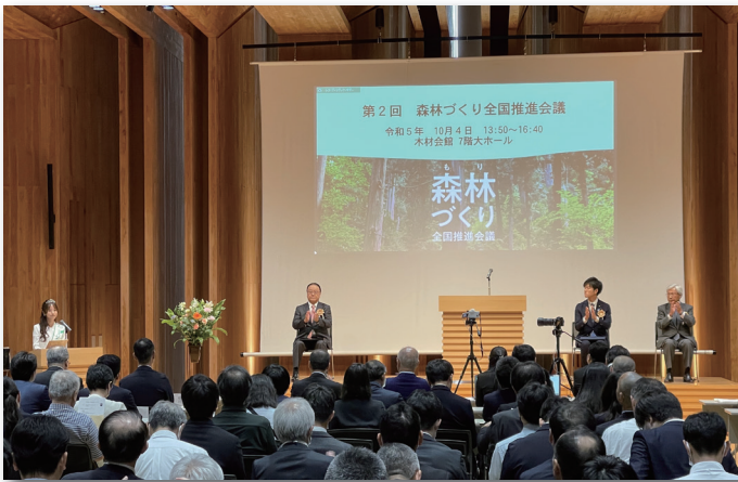
シンポジウム開催

このため、当機構では、「森のための4つのアクション（森にふれよう、木をつかおう、森をささえよう、森と暮らそう）」を普及するとともに、企業やNPOによる森林づくりに関する情報提供などの支援をしています。