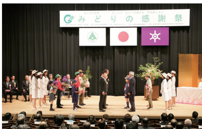
みどりの感謝祭式典

5月4日の「みどりの日」は国民の祝日で、国民一人ひとりが自然に親しむとともに、その恩恵に感謝し、豊かな心を育む日です。また、4月15日から5月14日までは「みどりの月間」です。この期間に、東京において「みどりの感謝祭」(式典には皇族殿下ご臨席)をはじめ、全国各地で「みどり」に関する様々な行事を重点的に開催しています。