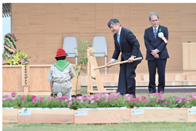
第 73 回全国植樹祭（岩手県）