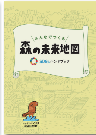
SDGsハンドブック(一般) 表紙