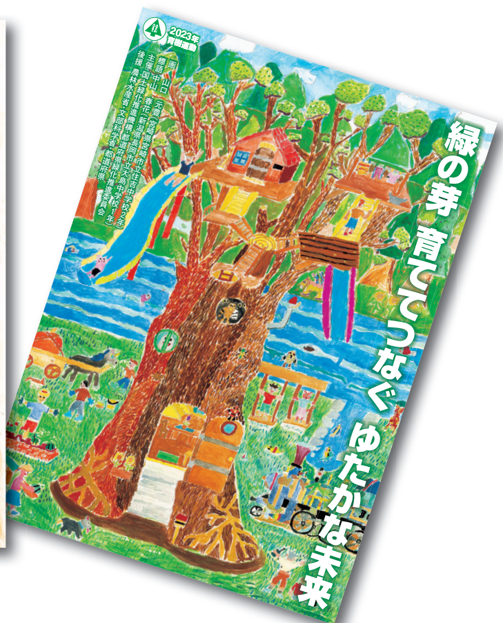
国土緑化運動・育樹運動ポスター原画コンクール （令和5年用 国土緑化運動ポスター・育樹運動ポスター）