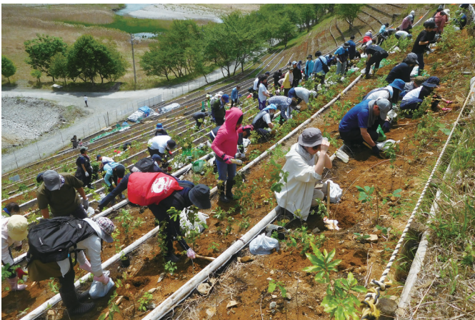
荒廃地の森林への復旧（栃木県）

緑の募金への寄付は、生物多様性の保全、子どもの森の学び、SDGsの達成、2050年カーボンニュートラルの実現などを目的とした市民団体などの森林づくり活動の支援に活用されています。