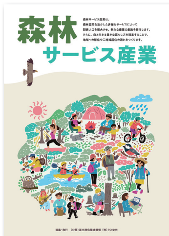
森林サービス産業パンフレット (表紙)

森林空間が生み出す恵みを活用した健康、観光、教育等に関わるサービスを、地域内で複合的に生み出す産業、それが「森林サービス産業」です。当機構では、「森林サービス産業」が創出・推進され、多くの市民が山村を訪れることにより緑化への関心が高まるよう、調査研究、情報提供、意見交換会等により活動支援を行っています。