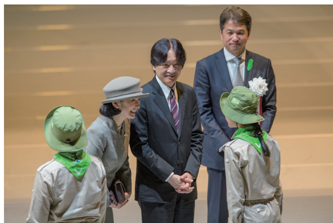
第 46 回全国育樹祭（茨城県）