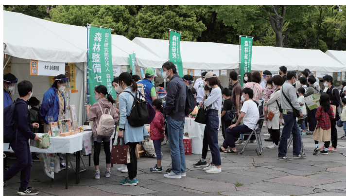
みどりとふれあうフェスティバル