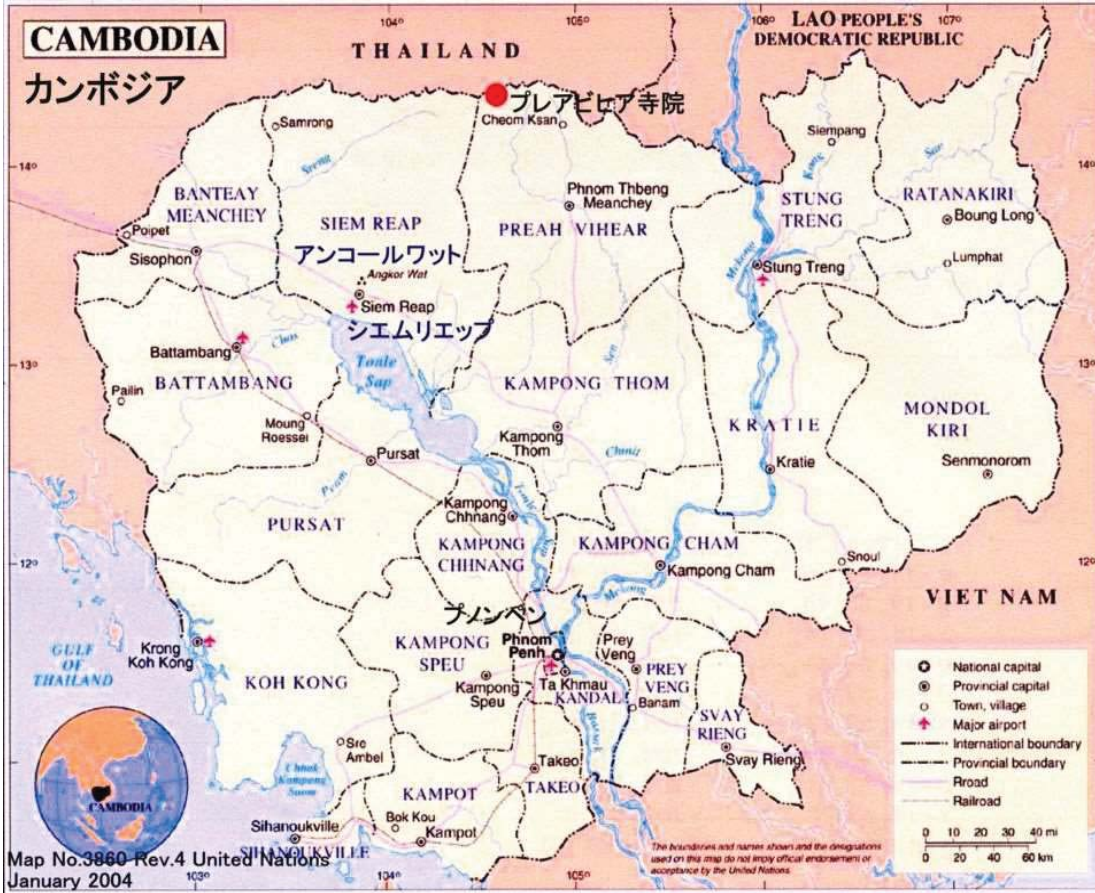
プリアビヒア寺院位置図