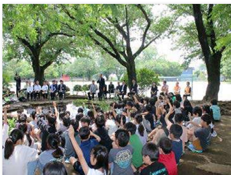
再生工事完了式典