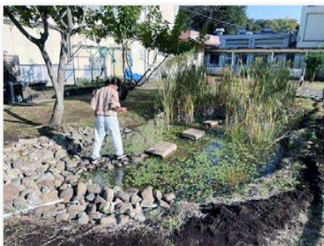
石を集めてエコトーンの岩場づくり