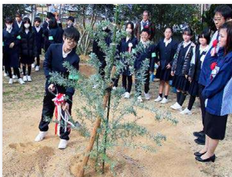
ミモザを記念植樹