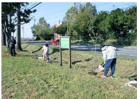
事業看板の両側に、児童代表が2本の木を記念植樹