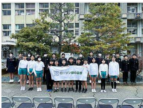
代表児童・職員など27人が参加