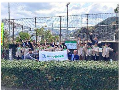
児童・教職員など35人が参加