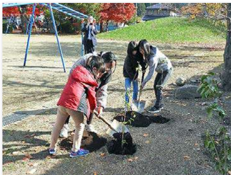
1年生と6年生が記念植樹