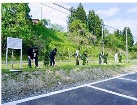
校木のイチイを記念植樹