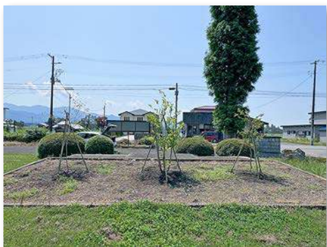
ナツツバキ、イロハモミジ、サルスベリを記念植樹