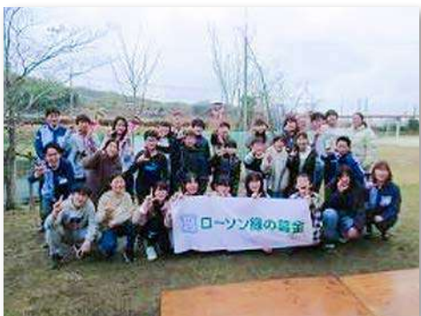
児童・教職員など38人が参加