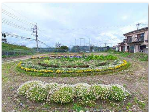
グリーンガーデンを整備