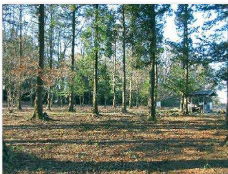
学校林整備後の様子②