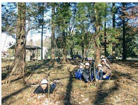
整備された学校林で校外授業