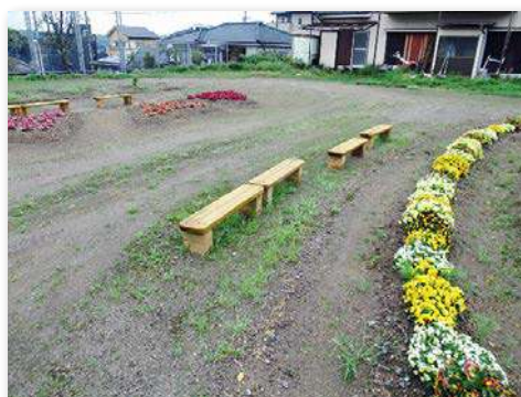
木製ベンチを設置