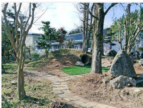
枝下ろしや剪定などの整備後