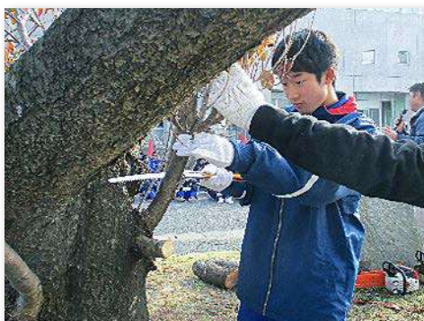
サクラの枝を剪定