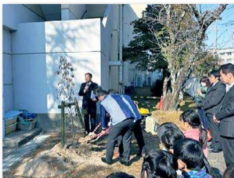
ヤマボウシを記念植樹