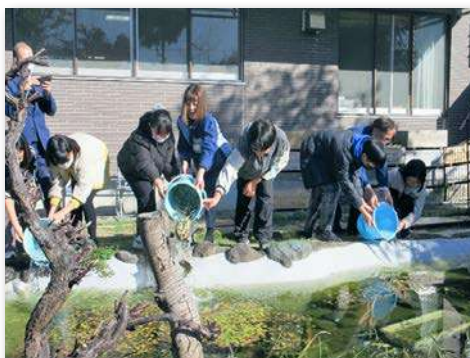
完成式典にて5種の淡水魚を放流