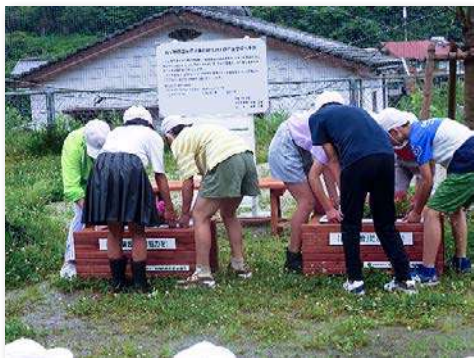
完成した「憩いの場」に花壇を設置