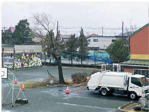
シダレヤナギの伐採