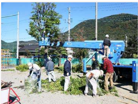
高所作業車を使用し校庭の樹木の枝を剪定