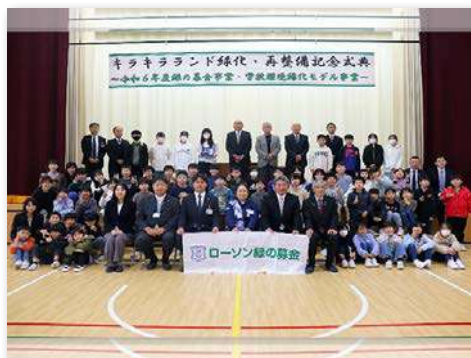
キラキラランド緑化再整備記念