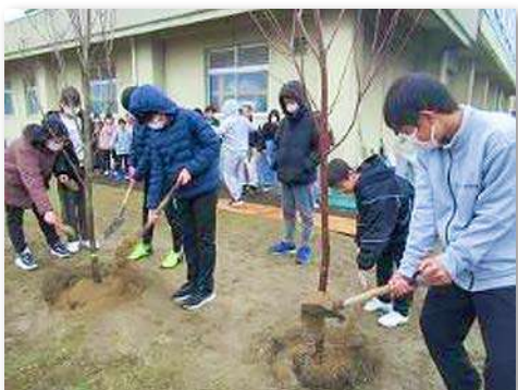
ソメイヨシノ、ハナミズキを記念植樹