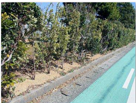
整備した正門横の生垣