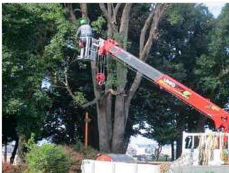
委託業者による剪定作業中