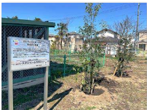
2本の植樹と看板の完成