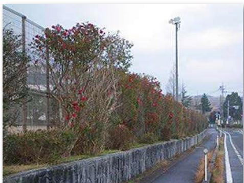
校庭外周通学路整備後