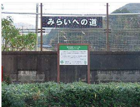
整備された道を「みらいへの道」と名付け、事業看板の上に設置