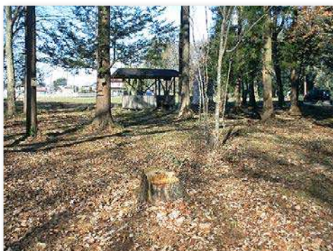
学校林整備後の様子①