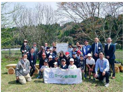
児童・教職員など35人が参加