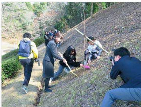
サクラを記念植樹