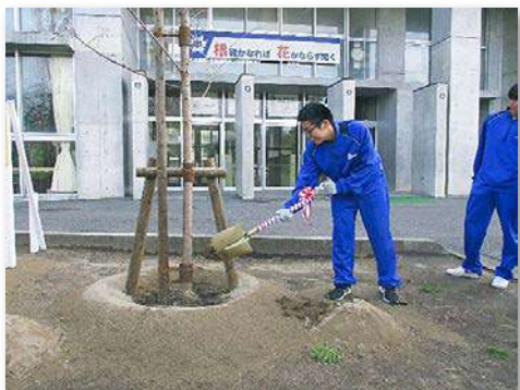
ソメイヨシノを記念植樹