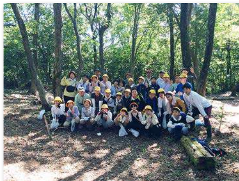
植樹後のクヌギと一緒に記念撮影