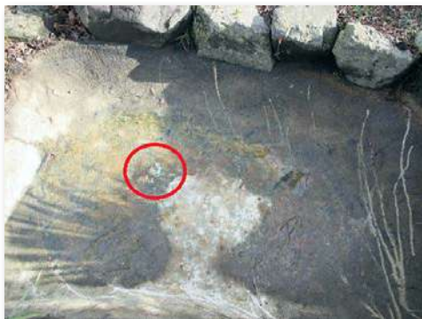
正門下ハス池の漏水箇所(赤丸の部分)