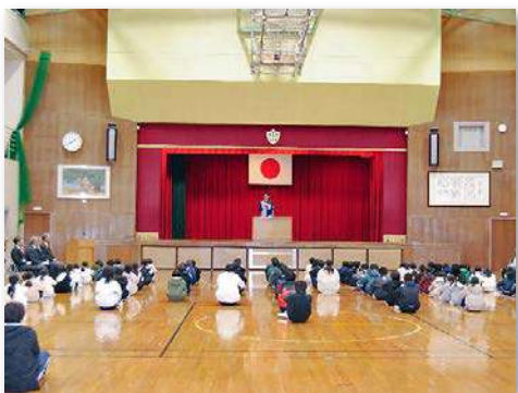
児童・教職員など90人が記念式典に参加