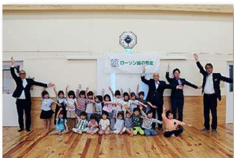
園児・教職員など約21人が参加