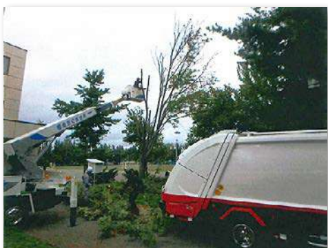
老齢化したナナカマドを伐採