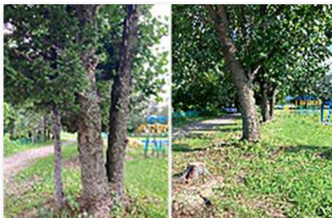
伐木作業前、作業後