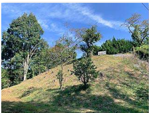
「小鳥の森」整備前の様子