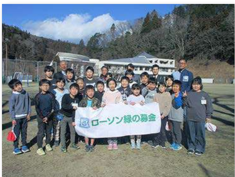
児童・教職員など40人が参加