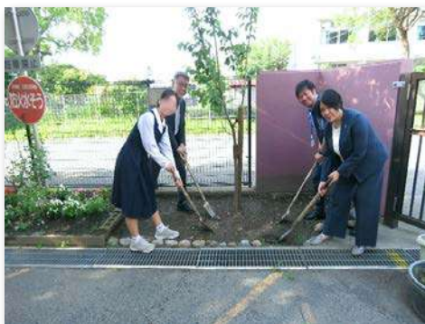
完成式典にてヤエザクラを記念植樹