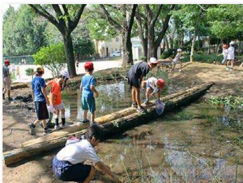
休み時間に自然に親しむ子どもたち