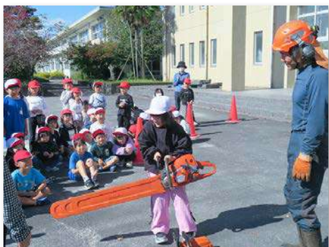
チェーンソーの重さを体験する児童 (伐採の授業)