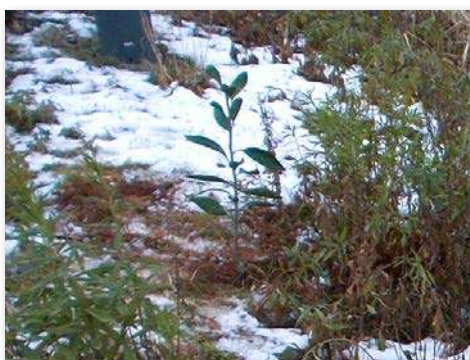
ミカンの苗木を植樹