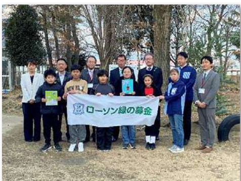
児童・教職員など約20人が参加