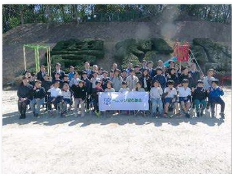
参加者全員の集合写真