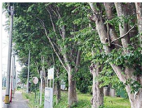
通学路のケヤキ整枝作業後