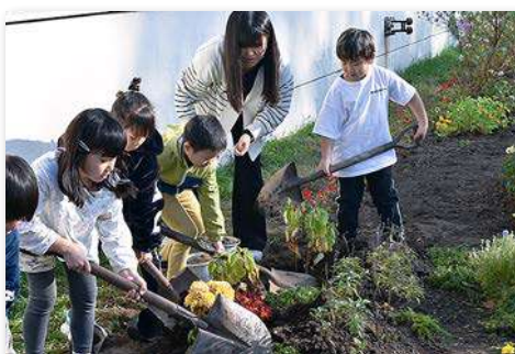
式典にて児童の代表者がギボウシやアナベルの苗を植栽