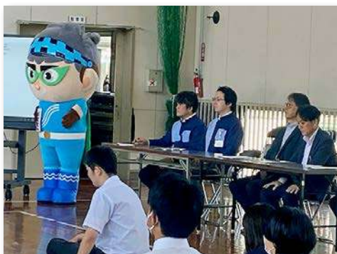
完成式典のご来賓の皆様