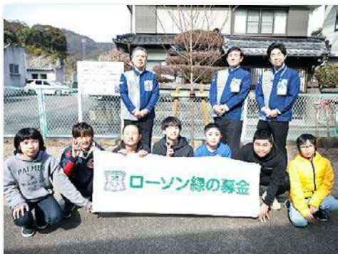
児童・教職員など24人が参加