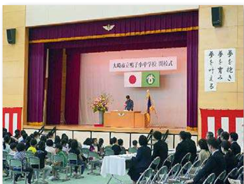
開校式後の完成式典