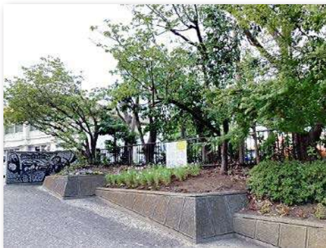
花壇整備後（花壇にコスモスやキキョウを植栽）