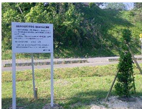
看板とイチイの木