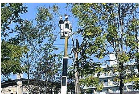
高所作業車を使用し枝の剪定作業