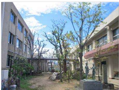
「友情の庭」整備後（全景）