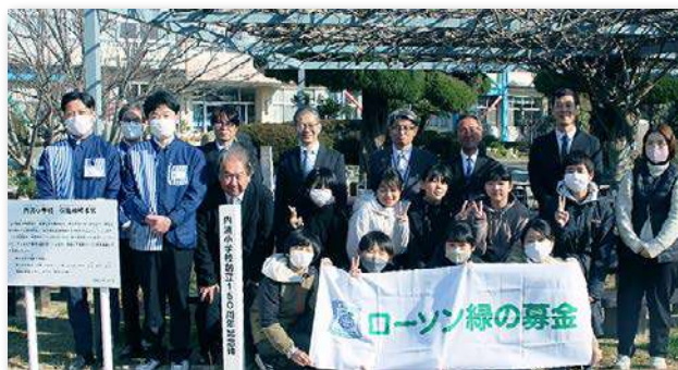
児童・教職員など約30人が参加