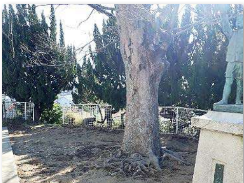
ケヤキの樹勢回復のため粘土層の除去作業を実施