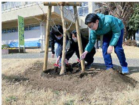
代表児童で記念植樹