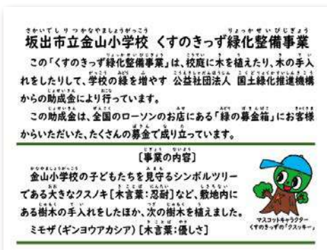
新たに設置した表示板の銘文