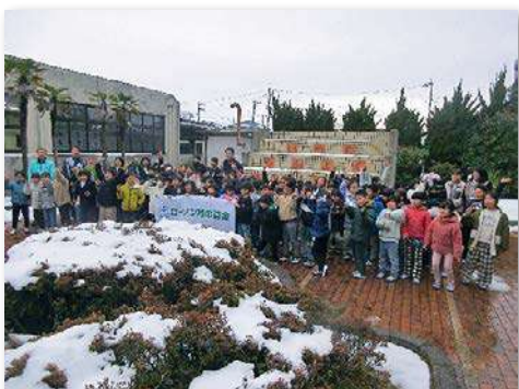
改修されたカナルの前で記念撮影