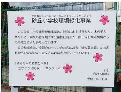
サクラをあしらった看板を設置