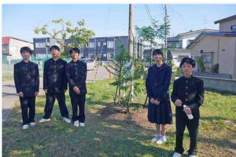
記念植樹をした生徒5名の記念撮影