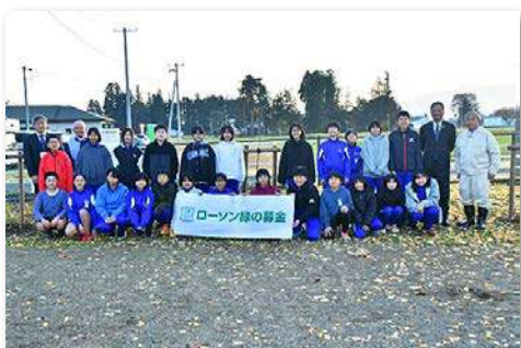
児童・教職員など39人が参加