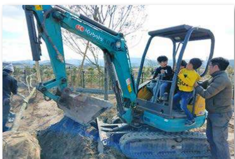
園児の重機操作体験