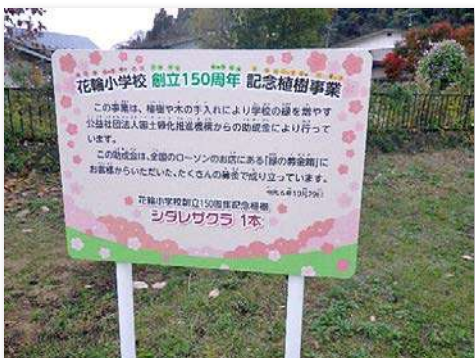
記念植樹の看板を設置