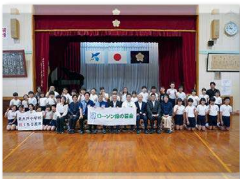
児童・教職員など150人が参加