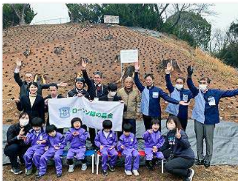
児童・教職員など23人が参加