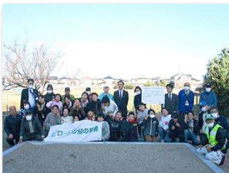
花壇完成セレモニー参加者集合写真