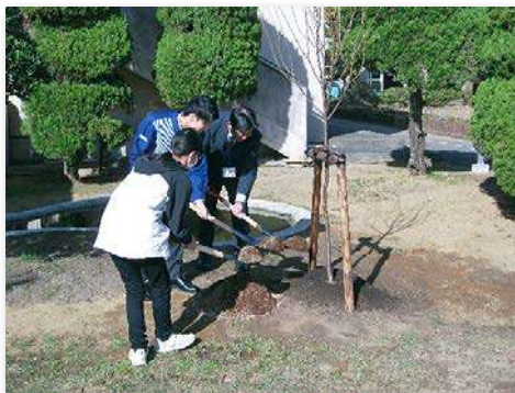
サクラを記念植樹