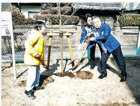
ジンダイアケボノを記念植樹