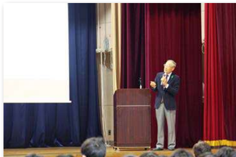
森林インストラクターによる講話