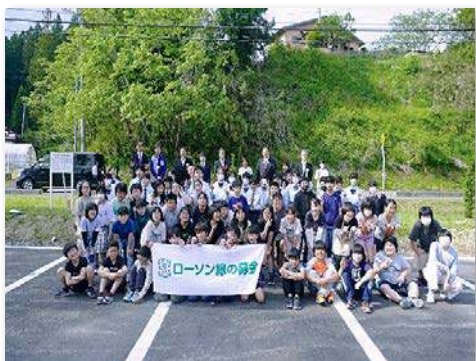
記念植樹後の記念撮影