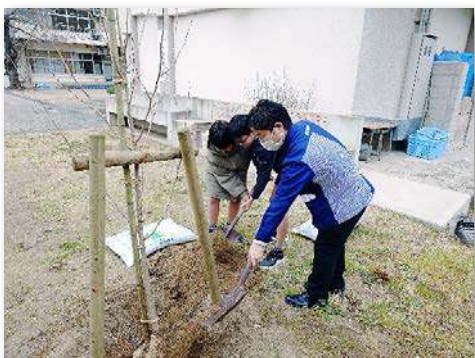
記念植樹で土かけの様子