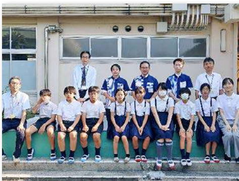
観察池前で記念写真