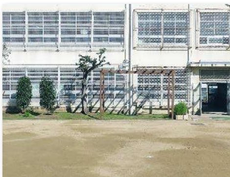
完成した若江の森