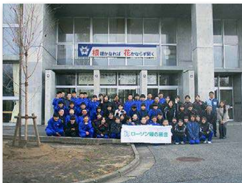
生徒・教職員など73人が参加