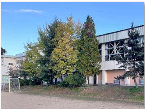
樹木の伐採、剪定（作業前）