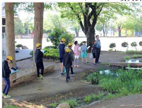
ビオスマイル委員会自然観察