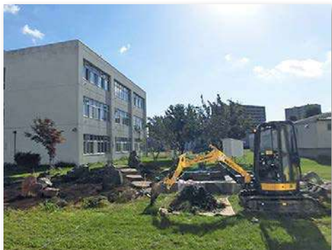
ロックガーデンの作業風景