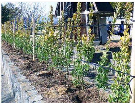
オウゴンマサキの生垣