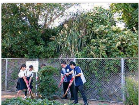
モッコクを記念植樹