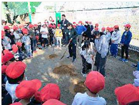
児童代表によるハナミズキの記念植樹