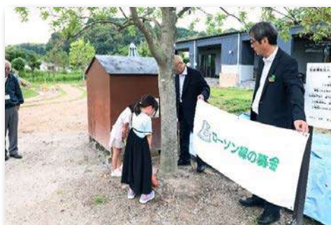
完成式典での記念植樹