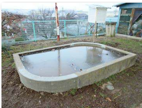
校舎横蓮池改修工事後