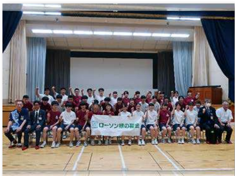
児童・教職員など124人が参加