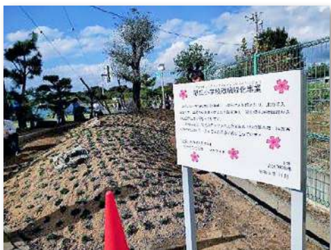
よみがえった校門前の築山花壇