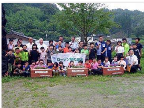
児童・教職員など55人が参加