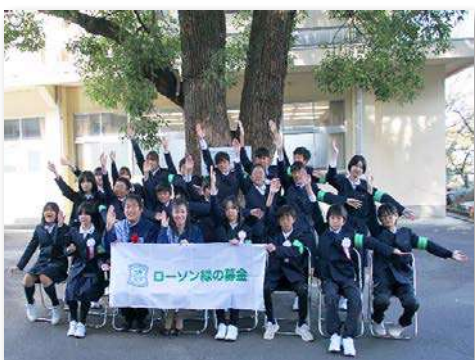
児童・教職員など32人が参加