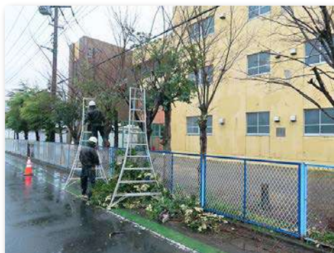
校地北側の樹木の剪定