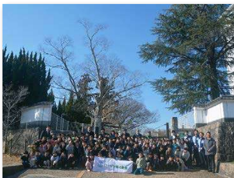
学校のシンボルであるケヤキと一緒に記念撮影