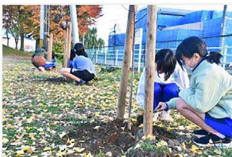
サクラを記念植樹