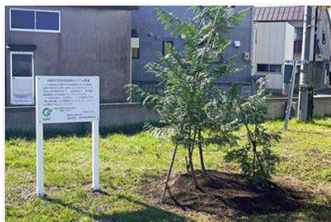
校地に植樹された青森ヒバ3本と看板