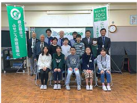
完成式典に児童・教職員・関係者など21人が参加