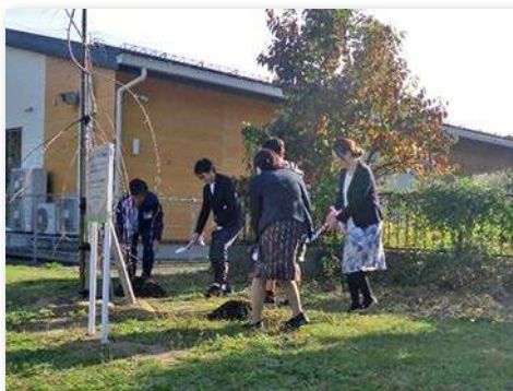
代表者で植樹作業