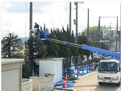
カイヅカイブキ・クスノキの剪定・枝払いを実施