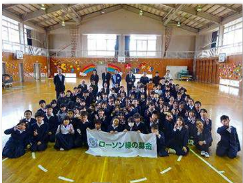
完成式典の記念撮影