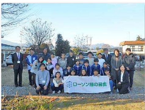
児童・教職員など31人が参加