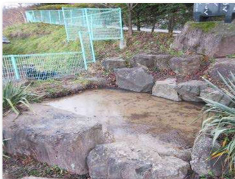
正門下ハス池の漏水箇所修繕後