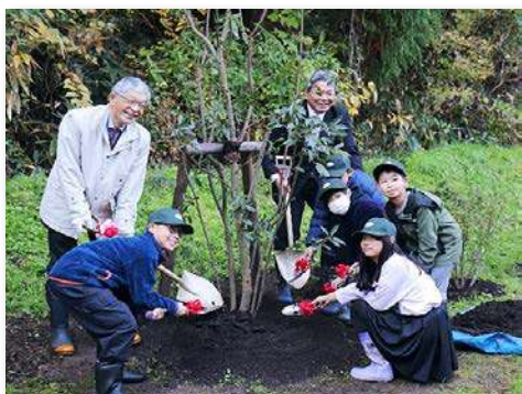
ゲッケイジュを記念植樹