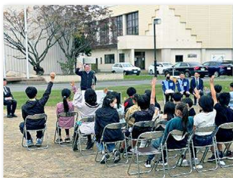
完成式典で児童が本事業について説明を受けている様子