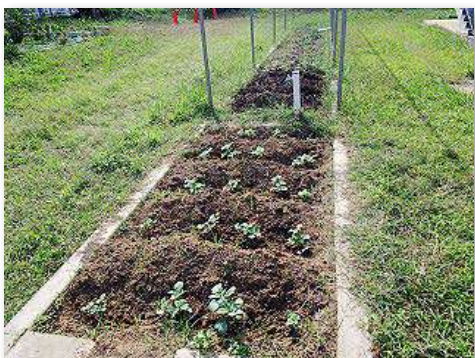
各学年花壇の土壌改良を行いイモの苗木を植栽