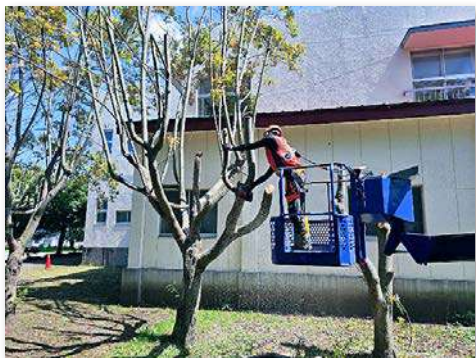
校庭内の緑化木の剪定作業の様子