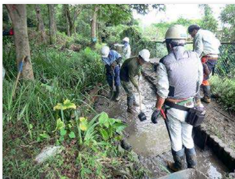
ビオトープの清掃