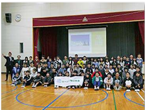
児童・教職員など519人が参加