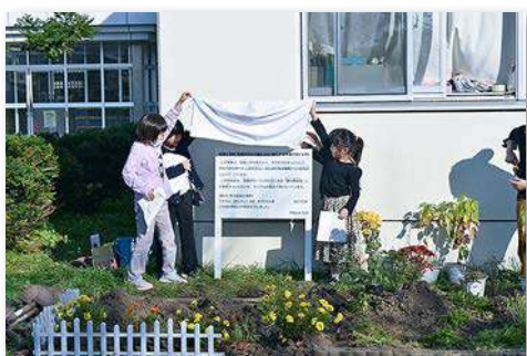
看板を設置。除幕式の様子