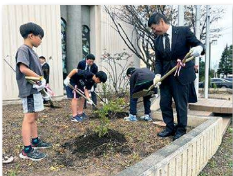
苗木を校長・来賓・贈呈者・児童代表4名により記念植樹