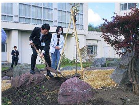
リンゴを記念植樹