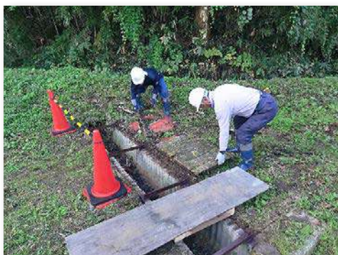
橋の架け替え作業