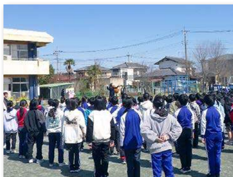
完成式典での全校合唱の様子