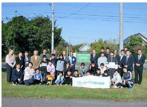
児童・教職員など約50人が参加