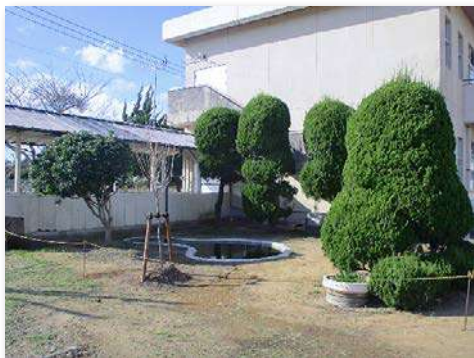
再生したビオトープ(全景)