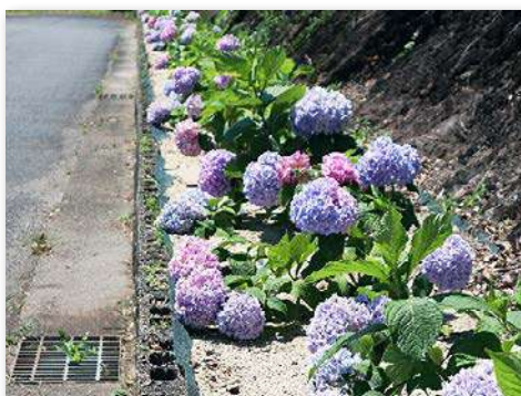
「あじさいロード」の完成