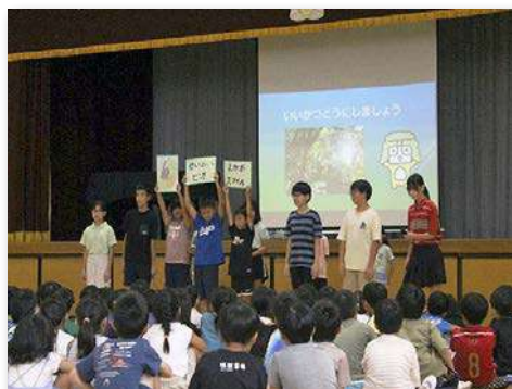
ビオスマイル委員会発足集会