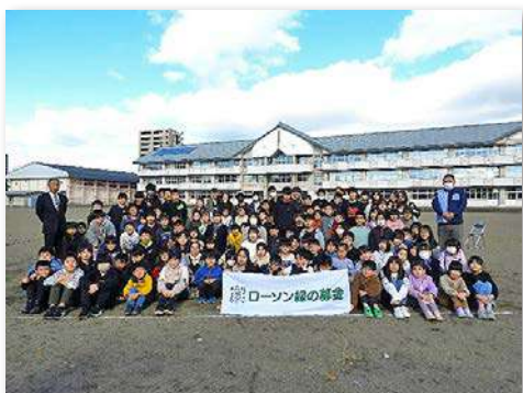
児童・教職員など112人が参加