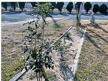
三大香木を植樹（秋はキンモクセイ、夏はクチナシ、冬はジンチョウゲの花を咲かせる）