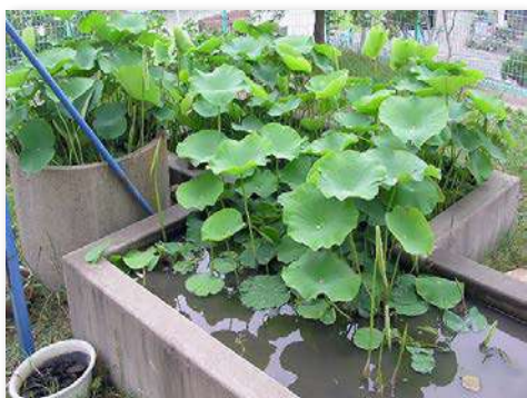
校舎横蓮池改修工事前