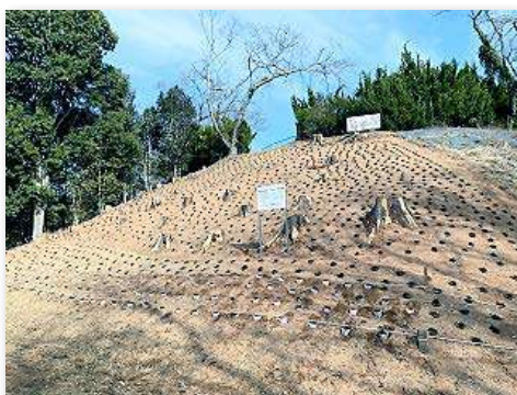
シバザクラを斜面一面に植栽