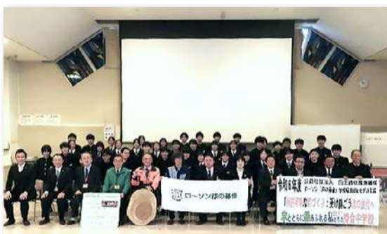
生徒・教職員など 50人が参加