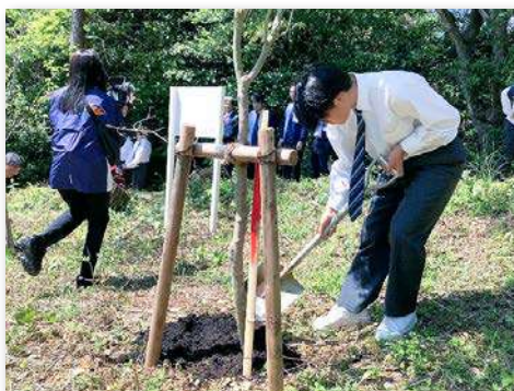
イロハモミジ、ヤマボウシを式典で植樹