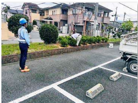
ヒラドツツジ植栽作業