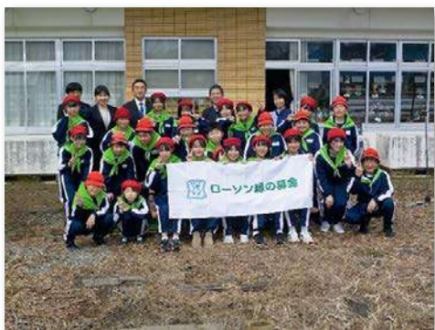
完成式典に花とみどりの少年団等が参加