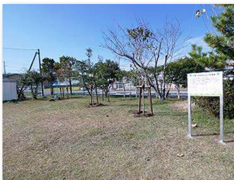
植樹した場所と事業看板