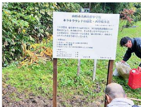
キラキラランド緑化再整備事業看板