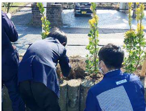
校庭の生垣にオウゴンマサキを全校児童が植樹