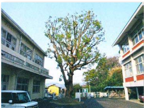
剪定後のクスノキ

・クスノキの手入れに参加し、その力強い姿に改めて感動した。子どもたちを見守り、長い年月をかけて成長してきた大樹の存在は、私たち教職員にとっても励みになる。クスノキの「忍耐」という木言葉は、子どもたちが困難に負けずに歩いていく力になると感じている。また、新たに植樹したミモザは「優しさ」の象徴として、児童たちが思いやりをはぐくむきっかけになると期待している。