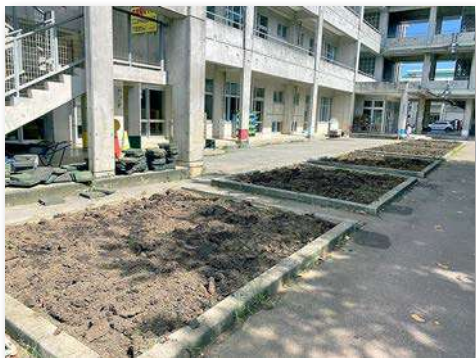
各学年花壇の土壌改良