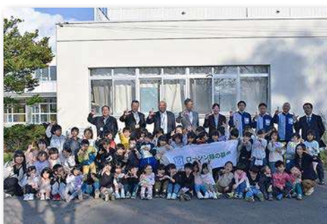
児童・教職員など約60人が参加