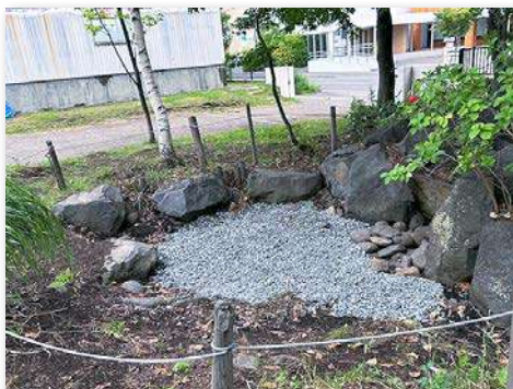
ビオトープ整備。流れに石を堆積・転圧