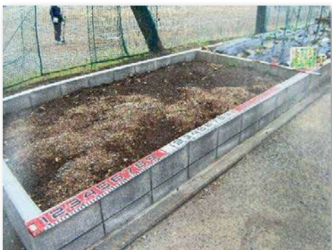
花壇の増設(植栽予定)