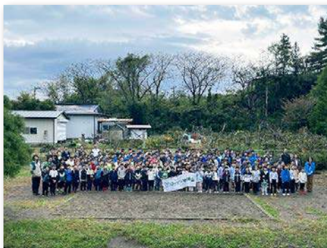
児童・教職員など272人が参加