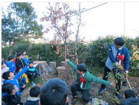
アラカシを記念植樹