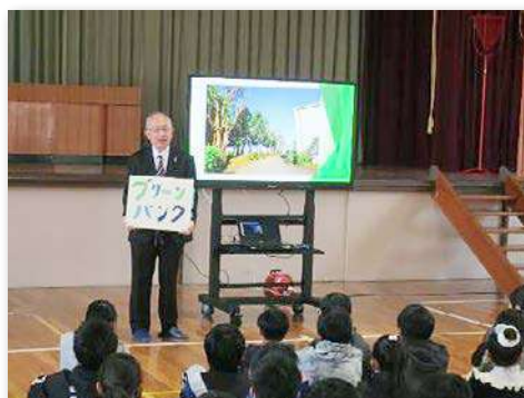
6年生全員が参加した完成式典