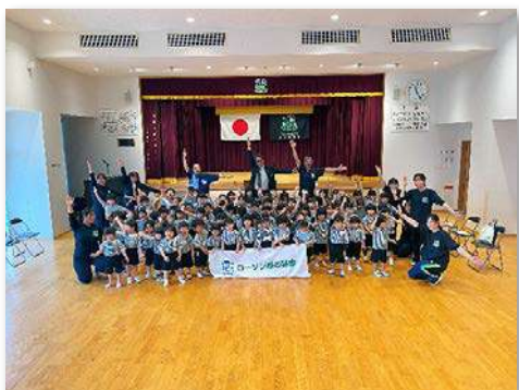
園児・教職員など約120人が参加