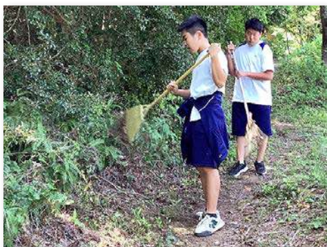
清掃活動（下刈の草を集める）