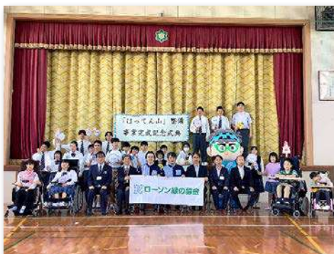
完成式典後の記念撮影