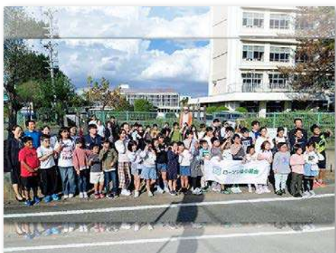
児童・教職員・地域の方々など70人が参加