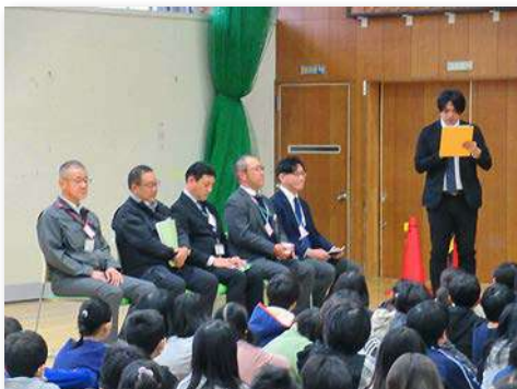
式典の開会(式典は体育館で実施、その後ビオトープの完成式典を校庭で実施)