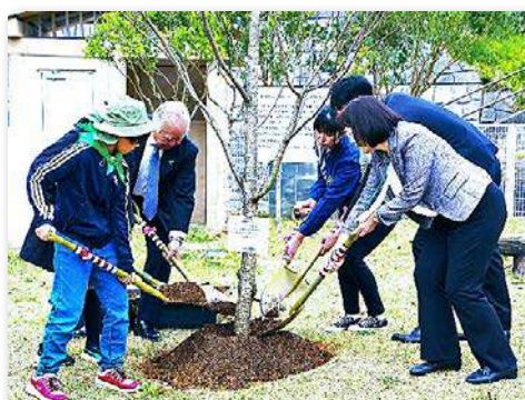
サクラ、ヤマボウシを記念植樹