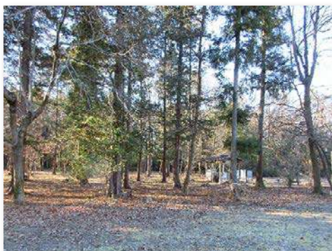
学校林整備後の様子③