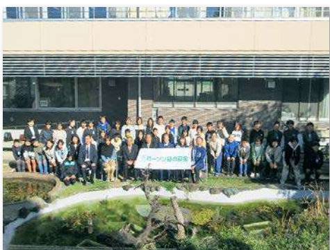
児童・教職員など約60人が参加