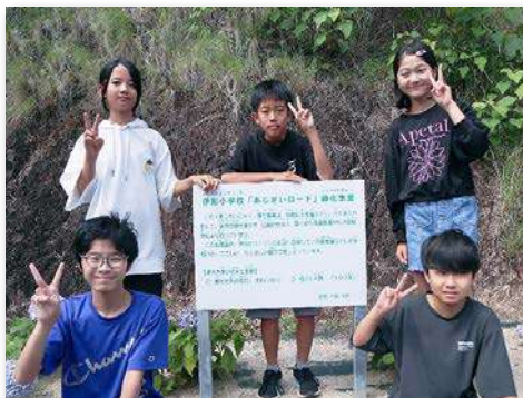
事業看板と記念撮影