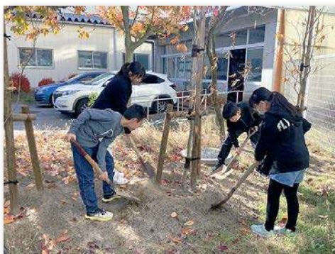
ブナを記念植樹（完成式典後日に実施）