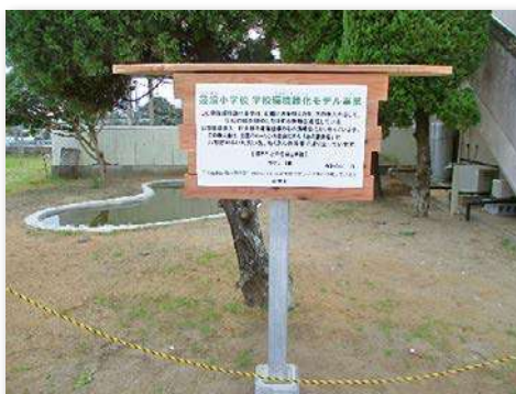
看板を設置(サンブスギを使用)