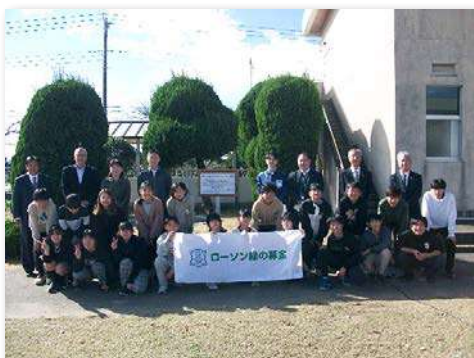
完成式典で記念撮影