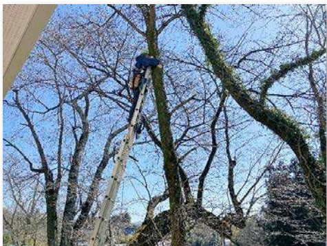
テングス病の除去