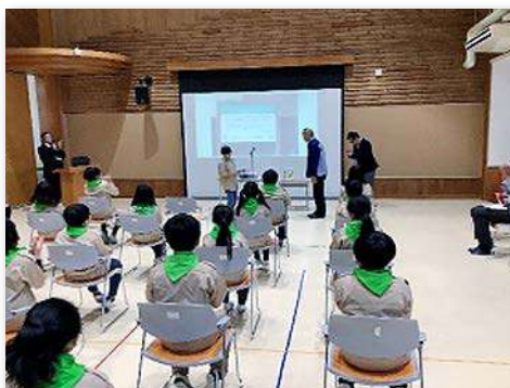
完成式典お礼のこぼ