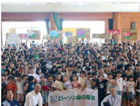
児童・教職員など286人が参加