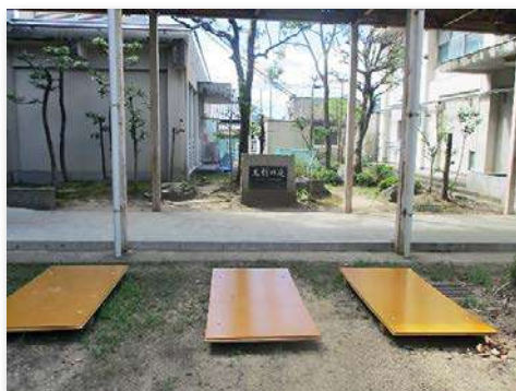
ジャンピングボードを設置