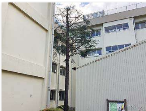
剪定したヒマラヤスギ