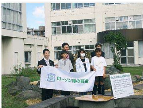
児童・教職員などが参加