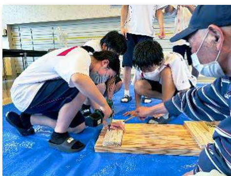
間伐材を利用したベンチの制作