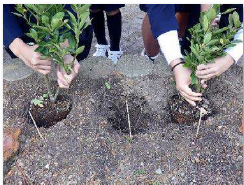
児童一人一人が丁寧に植樹