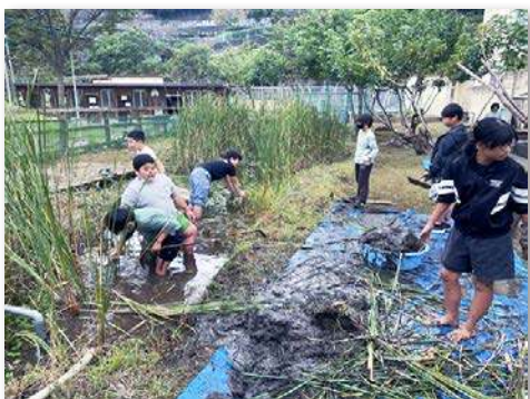
池のガマを間引く