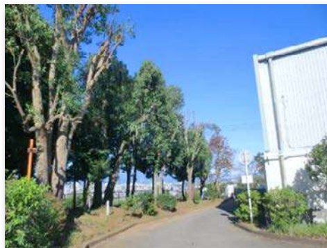
剪定・伐採して明るくなった向山の森