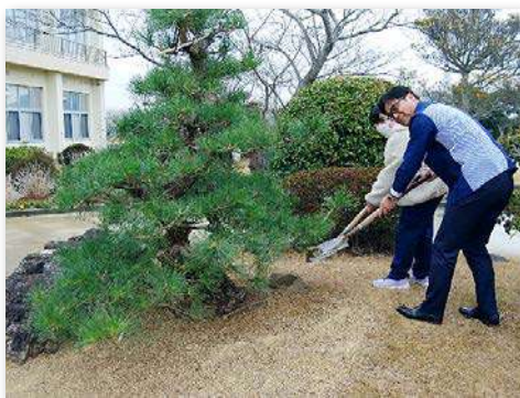
クロマツを記念植樹