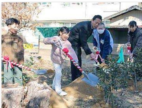
キンカンを記念植樹