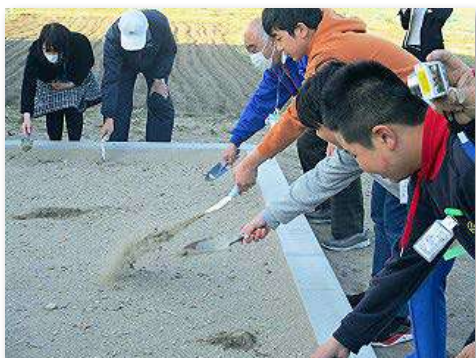
花壇に海辺の砂を入れる