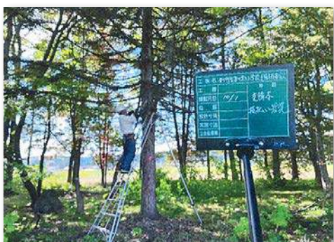
業者による支障木の伐採・枝払い作業の様子