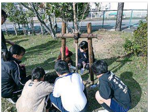
代表児童らで記念植樹