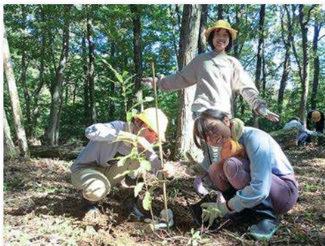
虚空蔵山でクヌギを植樹