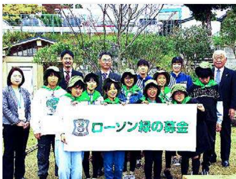
参加者で記念写真