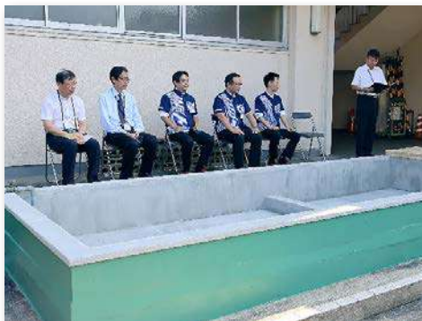
修繕した自然観察池で完成式典を実施