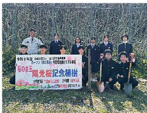
ヨウコウザクラを記念植樹