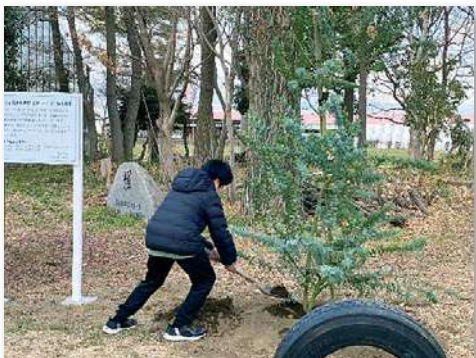
ミモザアカシアを記念植樹