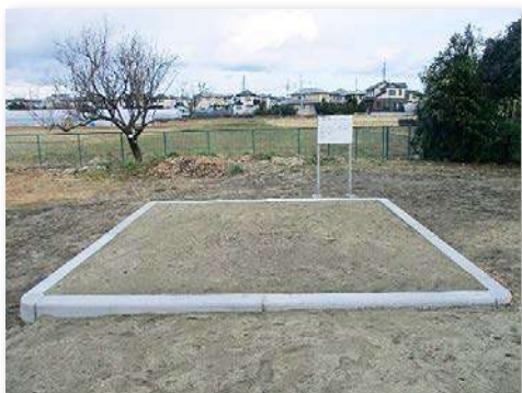
校舎東側のフィールドに設置された海浜植物用花壇