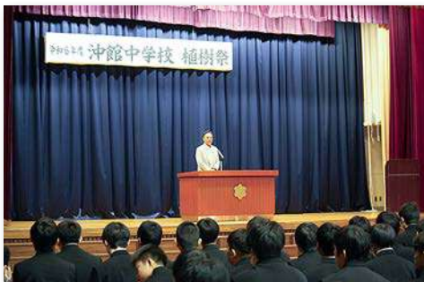
(公社) 青森県緑化推進委員会専務による事業説明