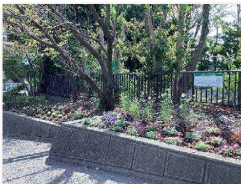
花壇後ろのフェンスに看板を設置