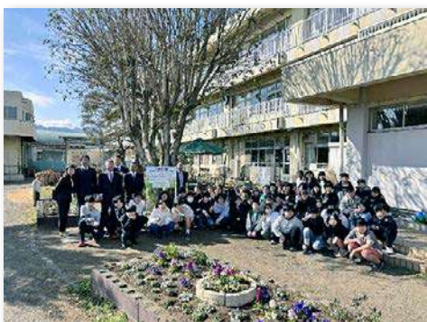
児童・関係者など約60人が参加