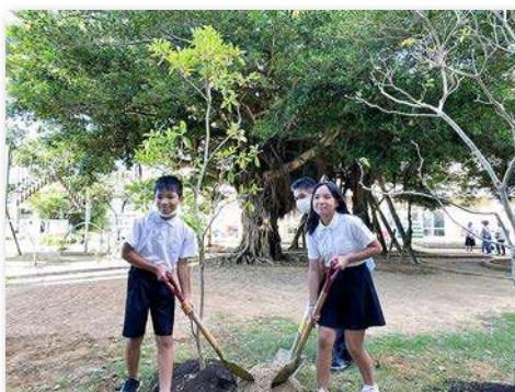
完成式典にて代表で6年生が肥料撒き