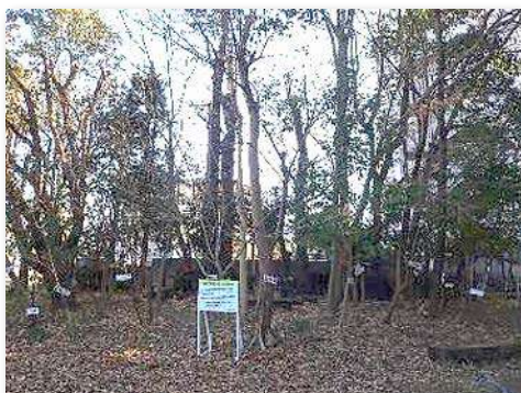
整備された学校林