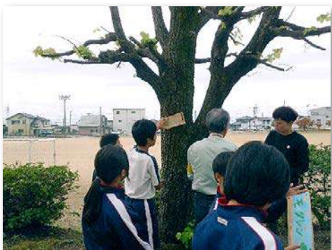
森林教室を開催し、樹名板を取り付け