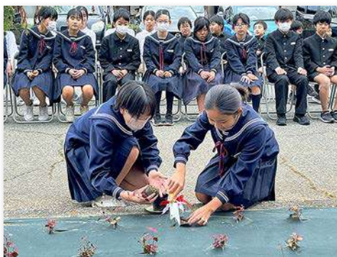
ハツユキカズラを記念植樹