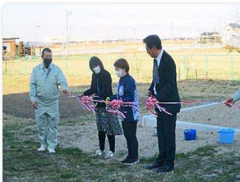
花壇完成セレモニー