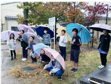
植樹したブナの前で記念撮影