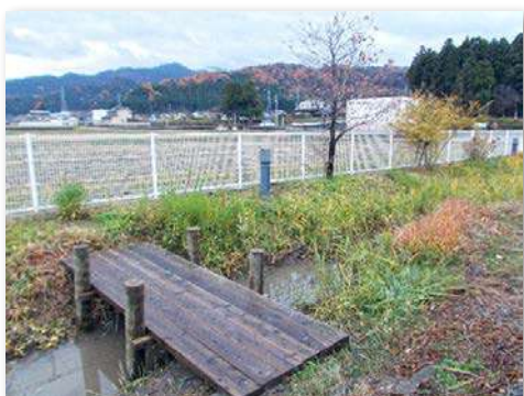
ビオトープの整備(木橋設置)

・皆さまのおかげで、新しい橋が架かった。向こう岸にも渡れるようになり、虫や生き物の観察がしやすくなった。これからは、新しい橋を使って、たくさん遊んだり、勉強したりしたい。ミカンの苗木はまだ小さいが、宇奈月小学校のシンボルになるように、大切に育てていきたい。