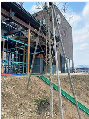
園庭に植えたブナ