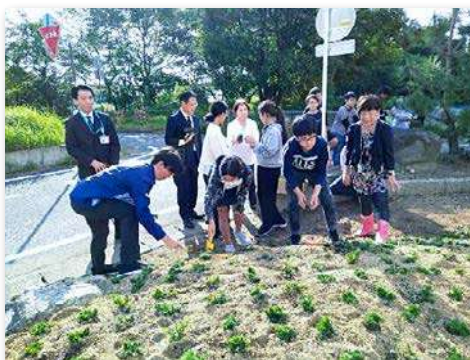
児童代表によるシバザクラの植付け