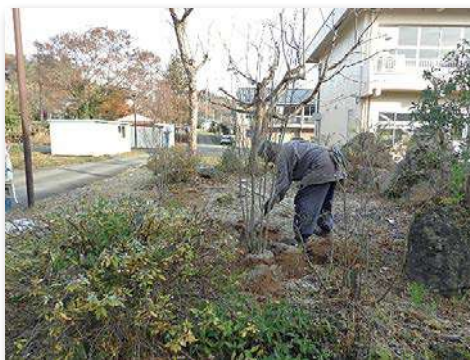
ヤマボウシを植樹