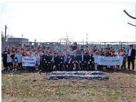
全校児童・教職員など80人が参加