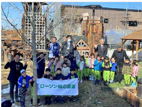
園児・教職員など約30人が参加