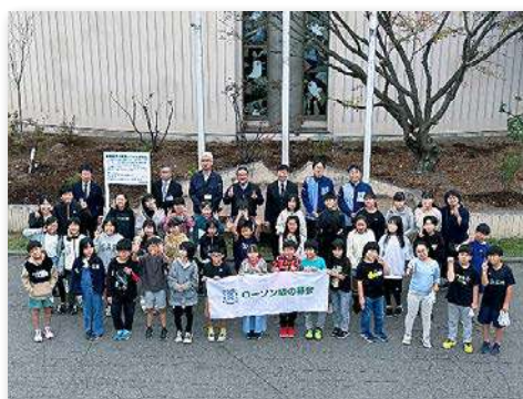
児童・教職員など約50人が参加