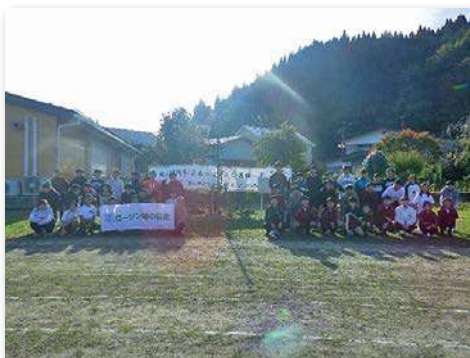
シダレザクラを囲んで記念撮影