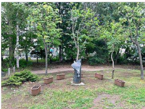
モニュメント周辺にプランター6基設置