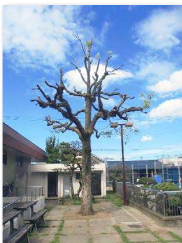
縮伐して安全になったクスノキ