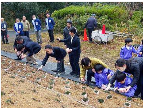
シバザクラを記念植栽