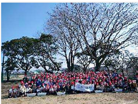
「なかぜの森」と完成記念式典に集まった児童