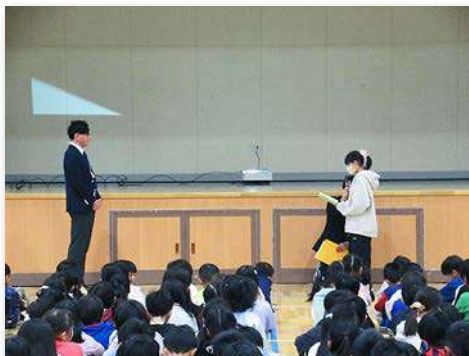
児童会長から助成いただいたことに対する感謝状をローソンの店長へ贈呈