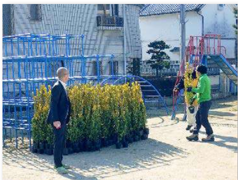
192本のオウゴンマサキの苗