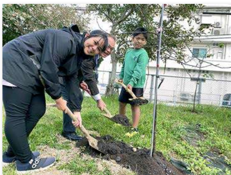
完成式典にて代表で6年生が肥料撒き