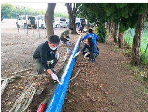
PTA、教員による丸太椅子の塗装