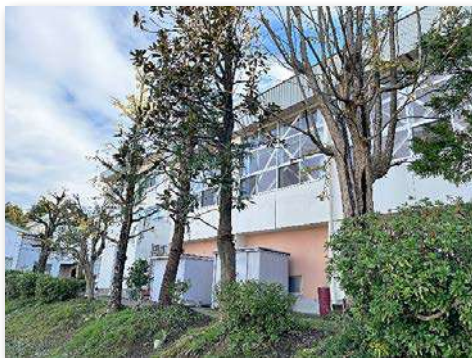
樹木の伐採、剪定（作業後）