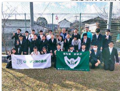
完成式典の集合写真