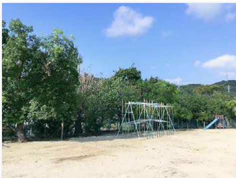
運動場南高木上部の枝下ろし作業後