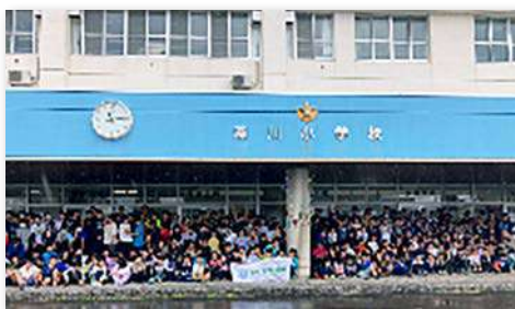
全校児童と式典参加者