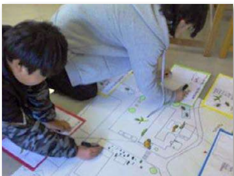
調査マップづくり