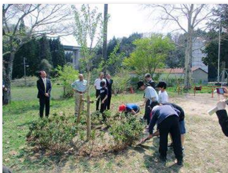
サクラ、ツツジを記念植樹