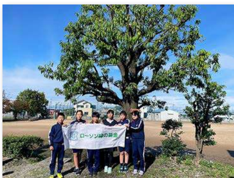
完成式典に飼育栽培委員会6名が参加