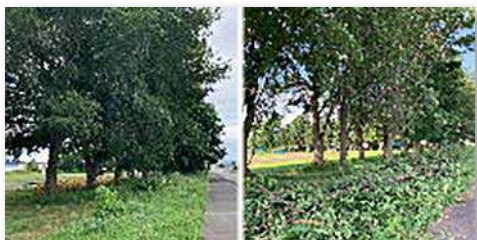
枝払い作業前、作業後