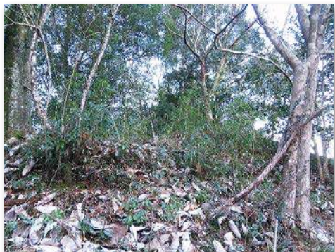
作業前の校内遊歩道沿い斜面の様子

・ササユリの保護活動を頑張って行ったが、日陰のところはあまり咲いていなかった。ササユリ教室が明るくなったので、来年もっとたくさんのササユリが咲くことを期待している。(6年児童)