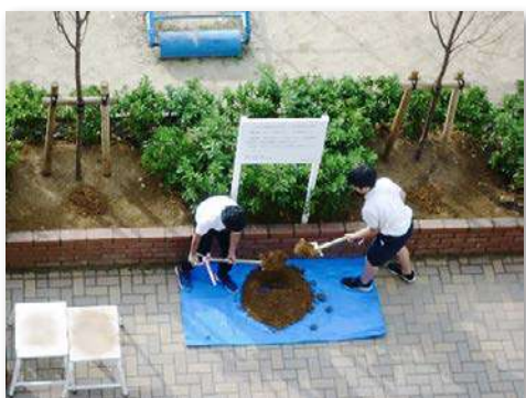
児童代表による記念植樹