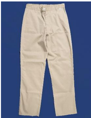
■長ズボン ¥5,940 (税込)