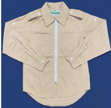
■上着（長袖） ¥6,380 (税込) 単位：cm