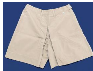
■キュロット ¥5,610 (税込) 単位：cm