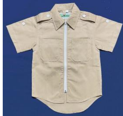
■上着（半袖） ¥6,270 (税込) 単位：cm