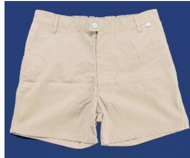
■半ズボン ¥5,610 (税込) 単位：cm