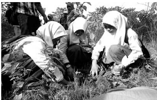
郷土樹種や果樹を中心に植樹