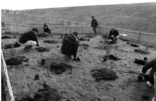
クロマツ、トベラなどを植樹