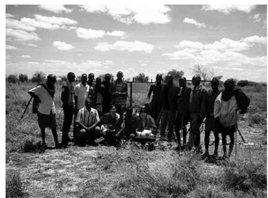
メリア、ニームなどを植樹