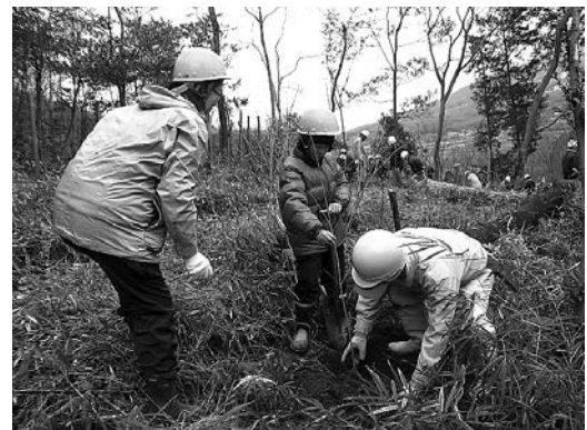
クヌギ、コナラなどを植樹