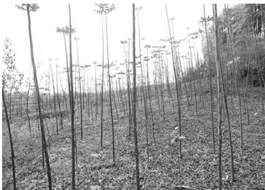
クスノキ、チャンチンを植樹