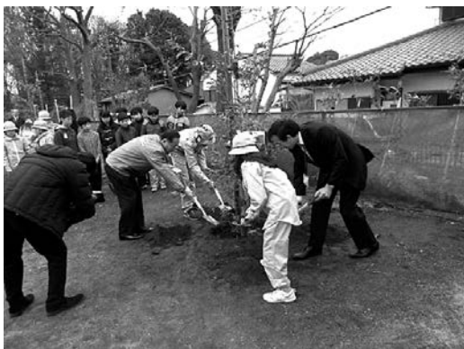
シイ、ブルーベリーなどを植樹