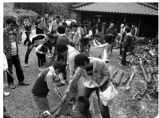
社員ボランティアによる薪割り薪づくり体験