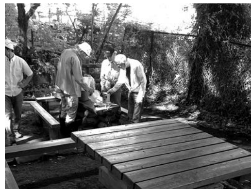
公園のベンチとテーブルの補修