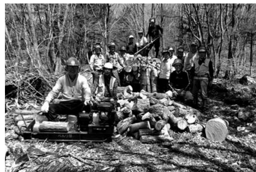
広葉樹間伐材の有効利用のため搬出して薪割り