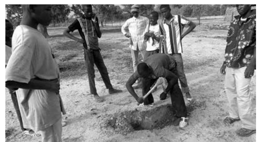
カリテ、ユーカリなどを植樹