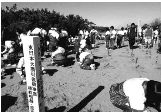
クロマツ・トベラなどを植樹