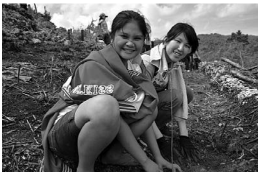
現地住民や学生と地震被害地での植樹