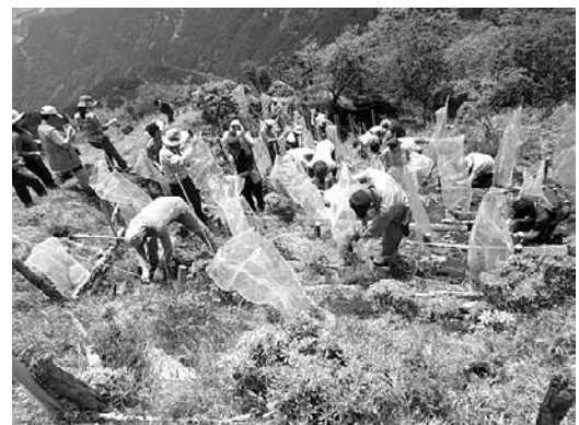
シカ食害対策としてネットを設置