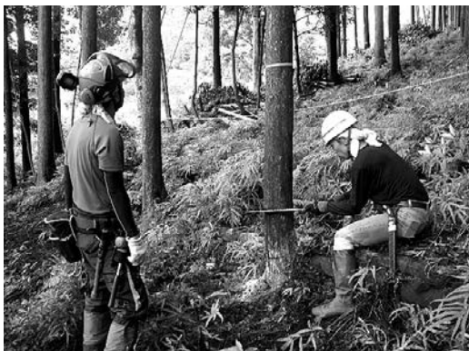
ノコギリでの間伐体験