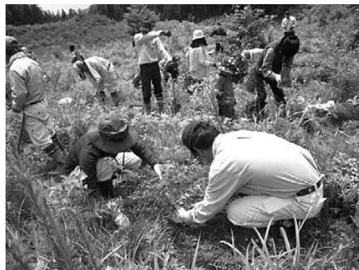
ミズナラ、カエデなどを植樹