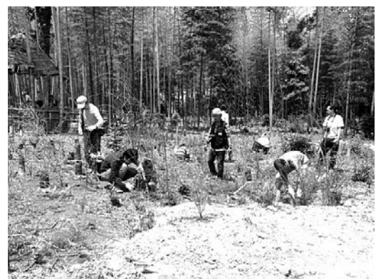
サクラやアジサイを植樹