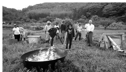
無煙炭化器での炭づくり