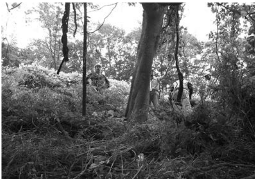
密生シノタケを刈り払い、景観を改善