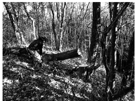
風倒木、不良木などを伐採