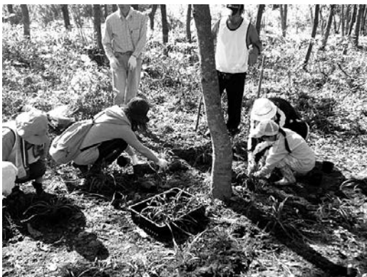
クヌギ、コナラなどを植樹