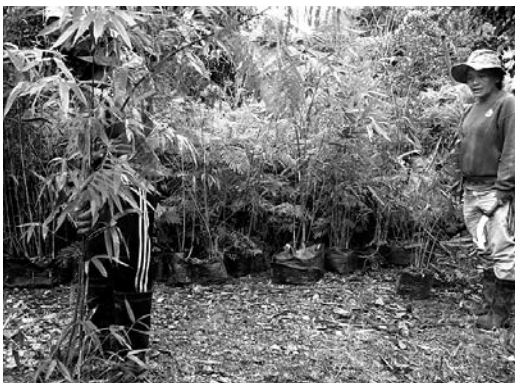
住民自ら苗木を育成・管理できるように指導