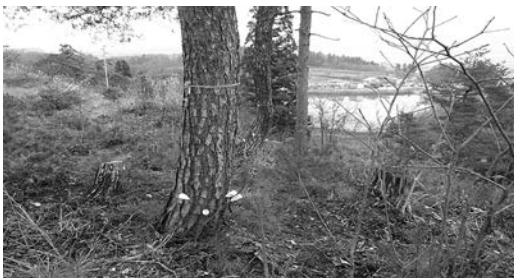
マツ枯れ防止剤を注入