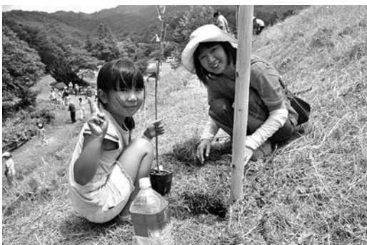
親子でヤマザクラ、ヤマツツジの植樹