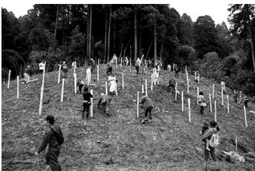
カエデ、モミジ、ナラなどを植樹