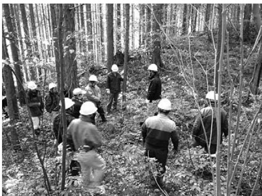
大田市での現地研修