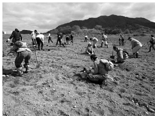
ヤチダモ、ヤマモミジ、ハルニレなどを植樹