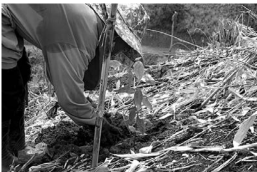
チーク、マホガニーなどを植樹