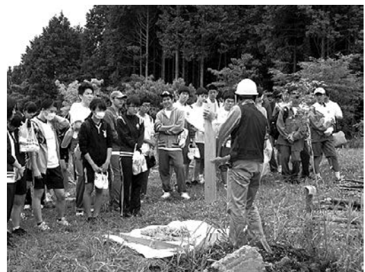
シカ食害防止柵の設置