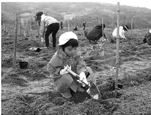
クヌギ・コナラなどを植樹