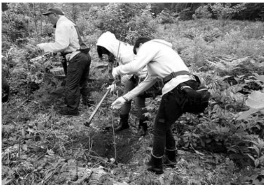
オオヤマザクラの植樹