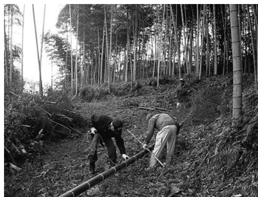
荒廃竹林(森林)の整備