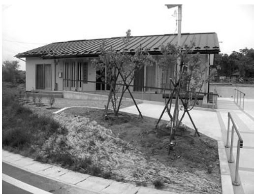
ウメ、ドウダンツツジなどを植樹