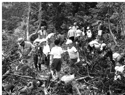
小学生による植樹