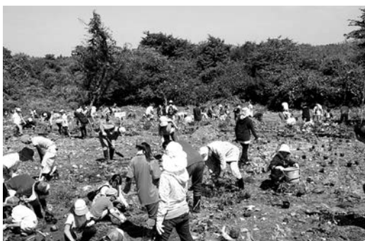
200人が参加した植樹祭