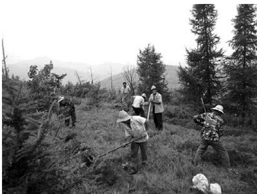
地元住民による植樹