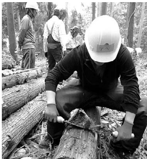
間伐材の皮むきを体験