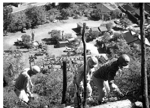
ケヤキ、コナラなどの植樹