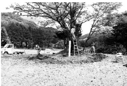
地域のシンボル ヤマザクラ