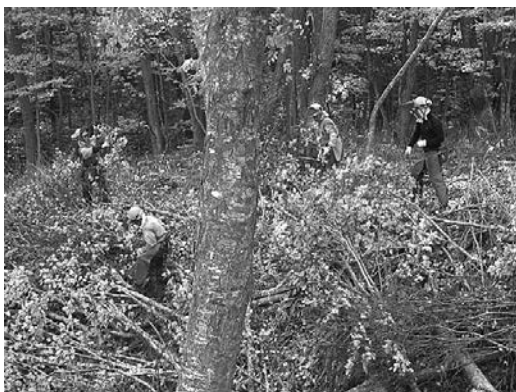
広葉樹を伐採して薪づくり