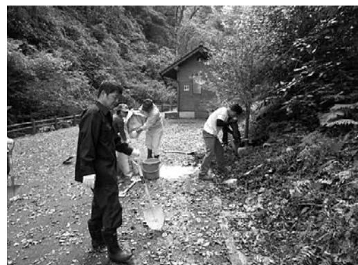
イロハモミジの植樹