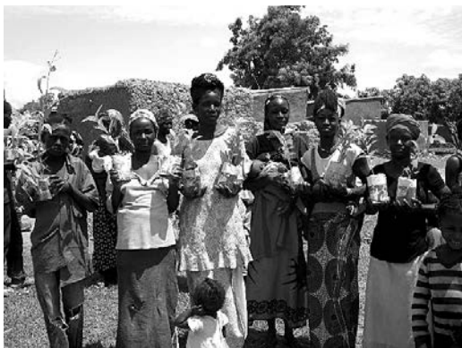
70村に2万1000本の苗木を配布、植樹