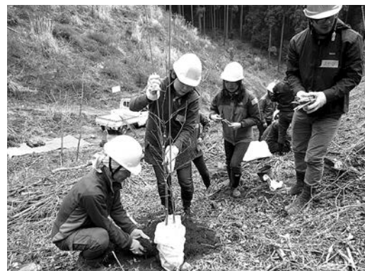
クヌギなどを植樹（埼玉県飯能市）