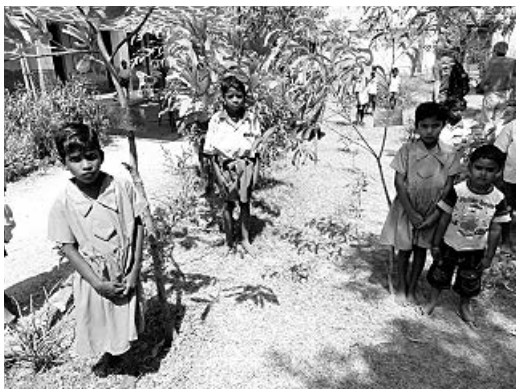
児童が植えた樹木