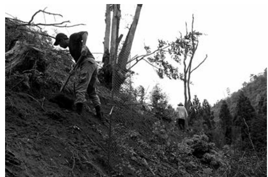
シカ食害防止ネットの設置