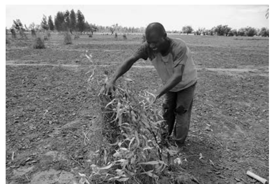
ユーカリ、マンゴーを植樹