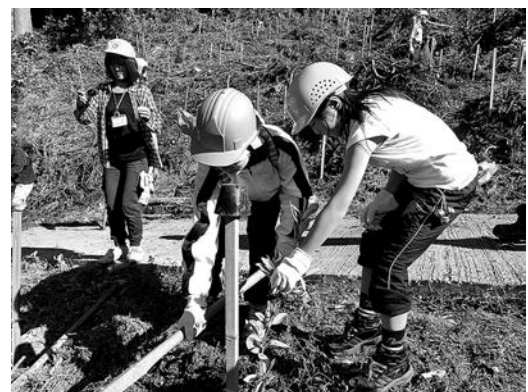
クヌギ、コナラなどを植樹