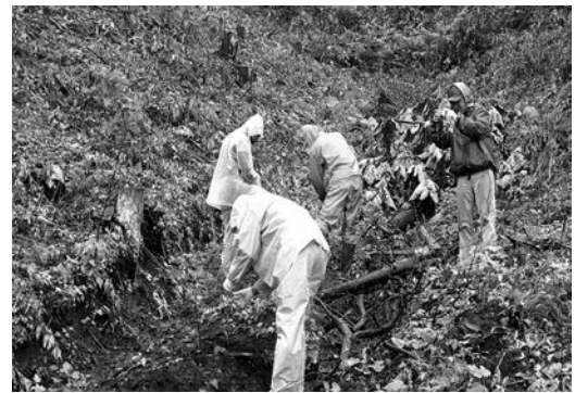
モミジやクリなどを植樹