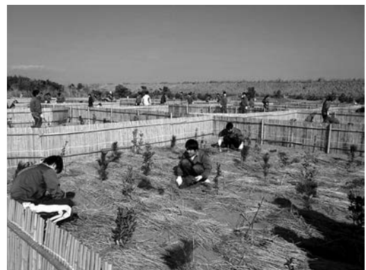
クロマツ、マサキ、トベラなどを植樹