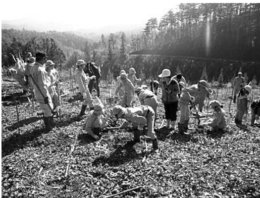
ヤマザクラの植樹