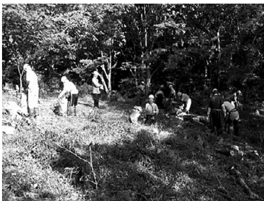
テング巣病の枝の処理