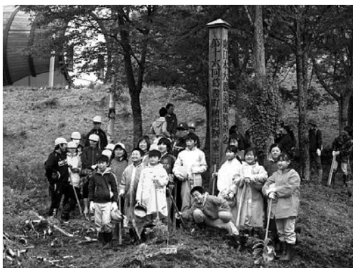
アオダモ、ツツジを植樹