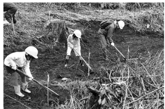
サクラやヒノキなどを植樹