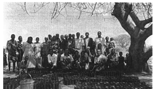
アカシア、ルキナなどを植樹