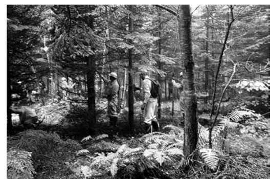
アカエゾマツの枝打ち