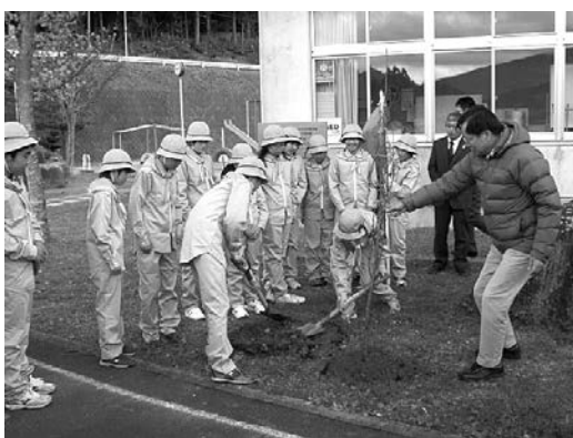
シダレザクラの植樹