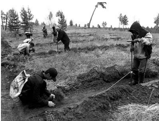
ヨーロッパアカマツの植樹