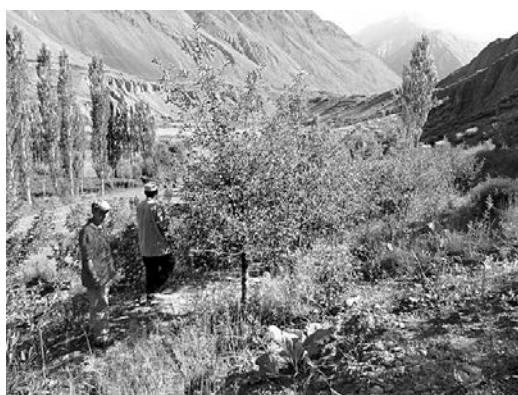
ポプラ防風林の設置