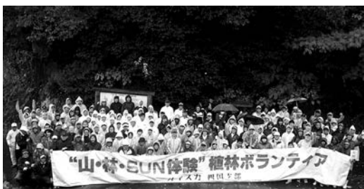
ヤマザクラを植樹