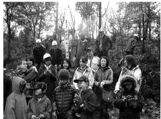
子どもたちも参加して森林整備