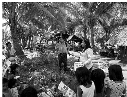
環境セミナー、植林ワークショップ