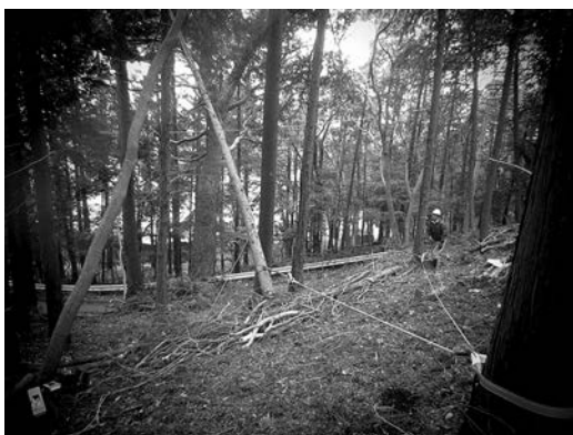
チルホール活用でかかり木処理作業