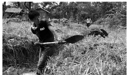
エコパークの整備