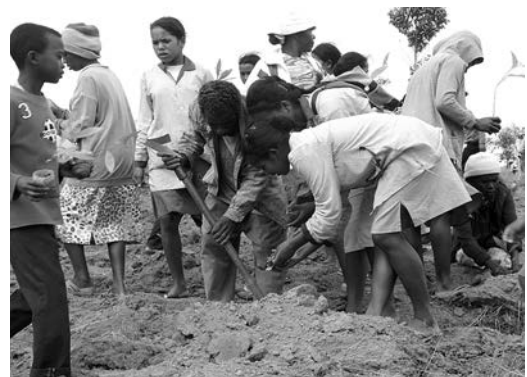
ライチ、コーヒー、アカシアなどを植樹