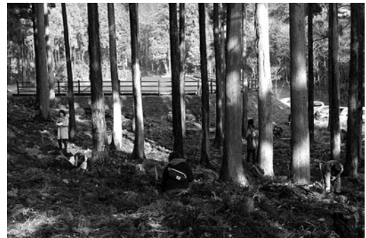
ヤクタネゴヨウの植樹