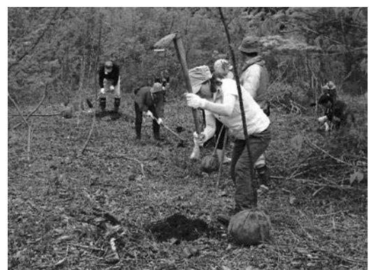
ヤマボウシやコブシなどを植樹