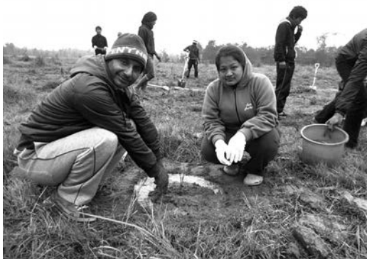
カキ、ロブシーなどを植樹