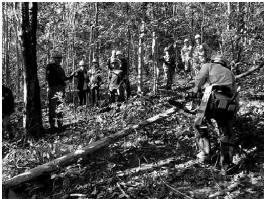
メンガ、シタンなどを植樹