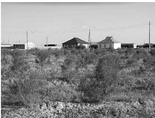
生育したサクサウル