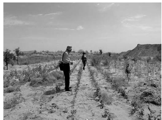
クワ、ニレ、ニセアカシアなどを植樹