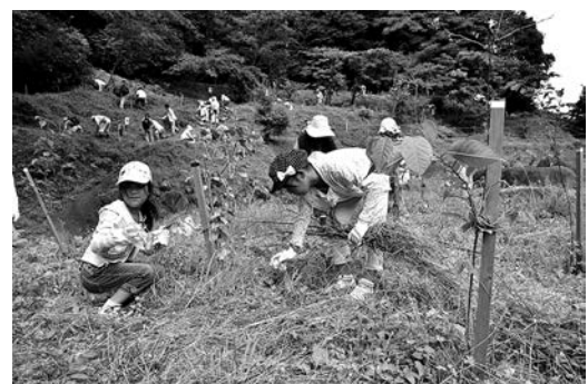
ソル切り・下刈り作業