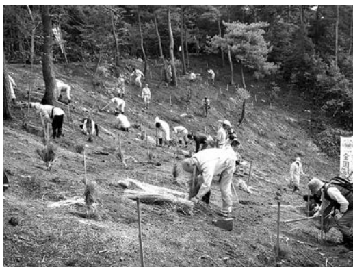
抵抗性クロマツの植樹