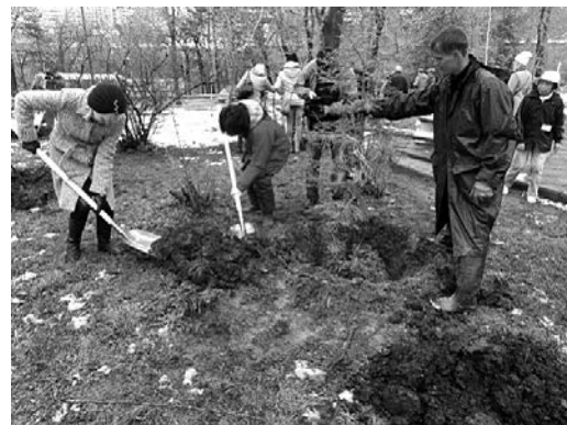
ハバロフスク市内で記念植樹