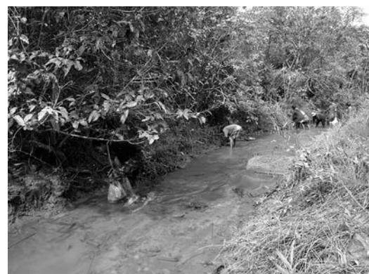
汽水域でのニッパヤシ(種子)の植樹