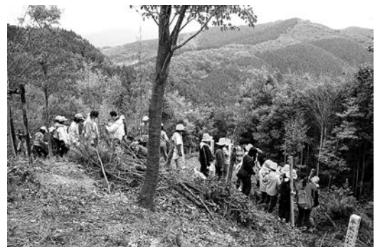
ケヤキ、モミジなどを植樹