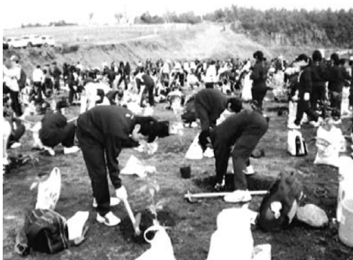
ウバメガシ、アラカシなどを植樹