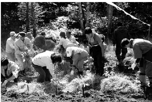
10年計画で植樹がすすめられる