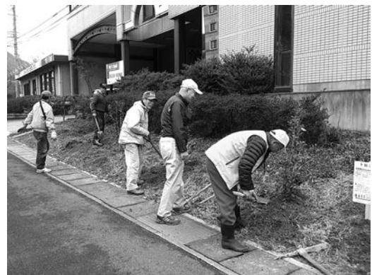
キンモクセイの植樹