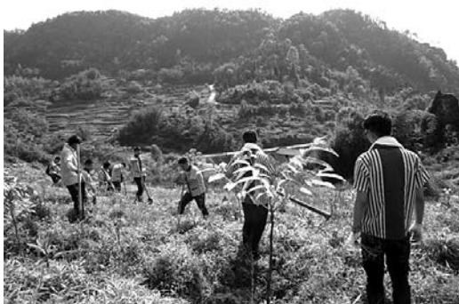
ユーカリ、クスノキなどを植樹