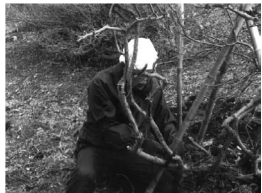
ヤマツツジ支柱設置作業