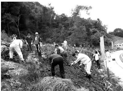
広葉樹13種類を植樹