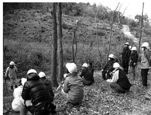
伐採跡地で振り返り