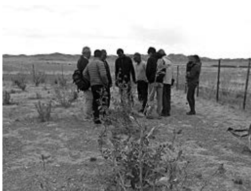
各育林地の生育状況のチェック