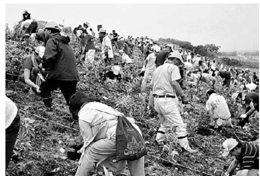
植樹には1100人が参加