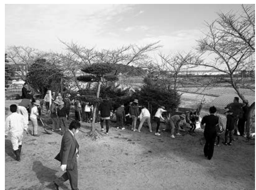
サザンカなどを植樹