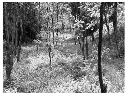
クルミの森整備地