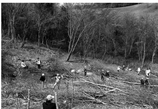
広葉樹の原木に植菌