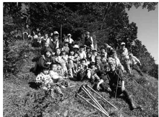
交流活動には子どもたちも参加