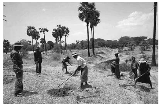
ユーカリ、アカシア類などを植樹