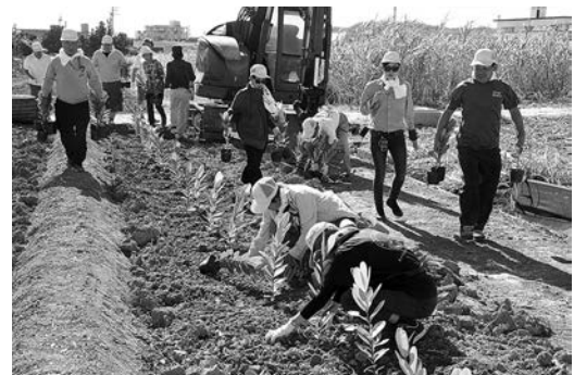
テリハボク、フクギなどを植樹