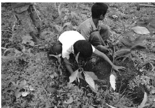
子どもたちによる植樹