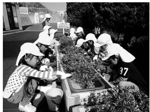
県産材を使用したプランターへの植樹