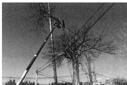
クレーンによる剪定作業