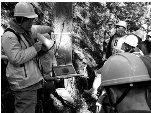
3回の研修を行った