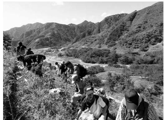
コナラ、ヤマボウシ、ヤマザクラなどを植樹