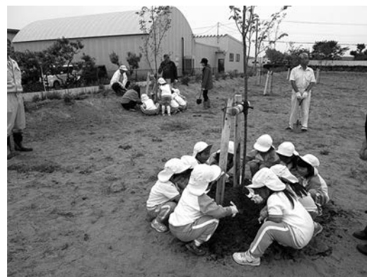
ヤマボウシ、サルスベリなどを植樹