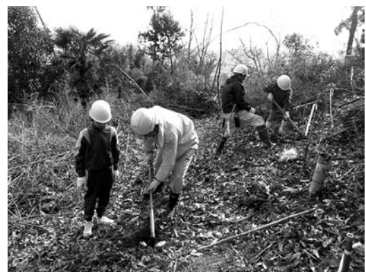
ヤマザクラの植樹