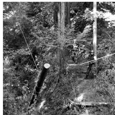
ロープワークで伐採木の搬出