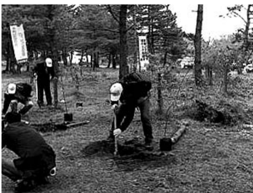
ドングリの森植樹