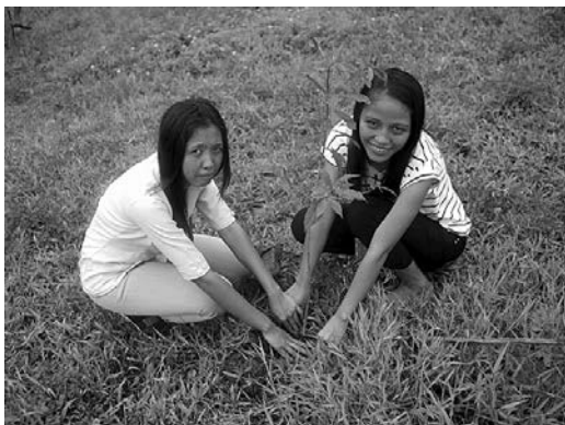
現地住民や学生との現地固有樹種の植樹