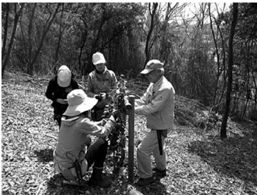
「市民に愛される森」をめざして整備