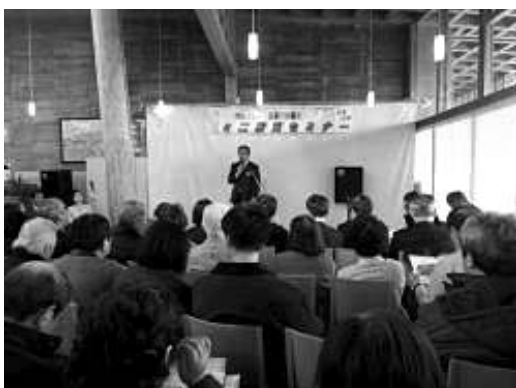
海岸林再生などに関する講演