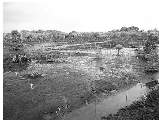
ラモン湾でのマングローブ植林地