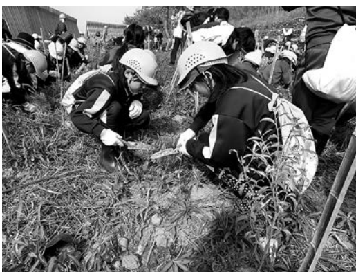
マツ、グミなどを植樹