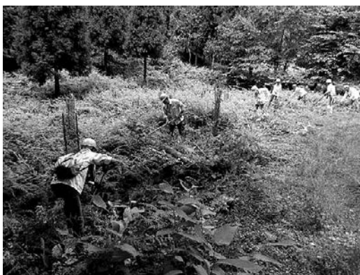
植林地の下刈り作業