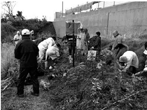
スタジイ、モチノキなどを植樹