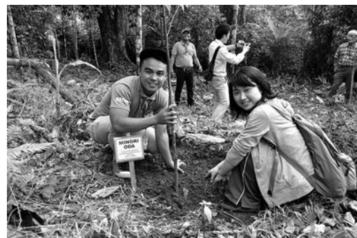
現地大学生といっしょに植樹