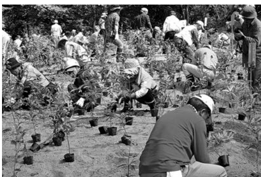
アカガシなどを植樹