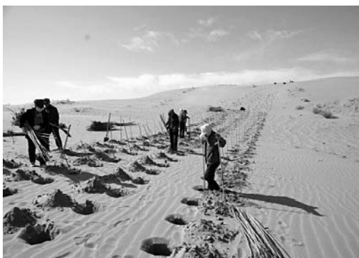
ポプラなどを植樹