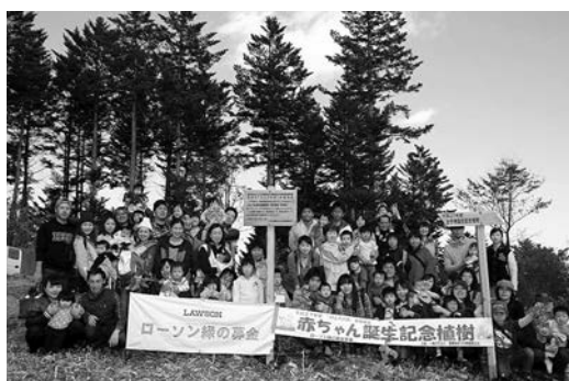
赤ちゃん誕生記念植樹