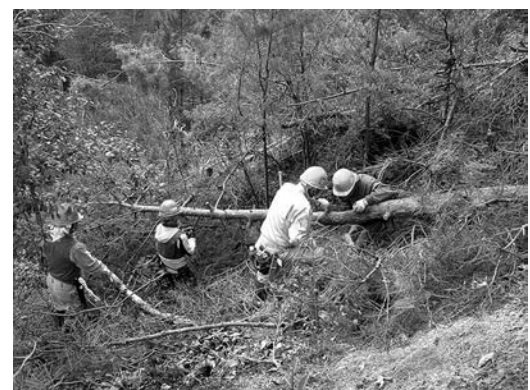
枯れたアカマツの伐採