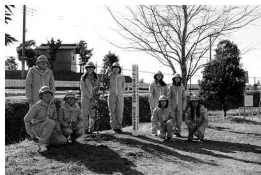
緑の少年団による植樹