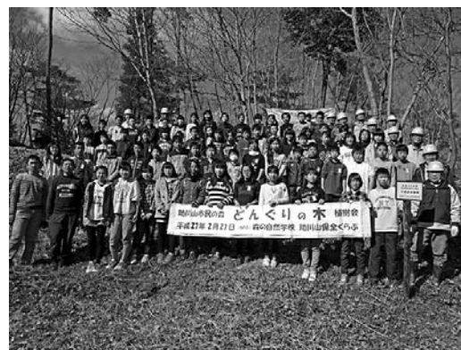
日立市立成沢小学校6年生全員 卒業記念植樹会