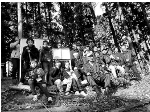
森林を整備して、地域の歴史を見つめ直す