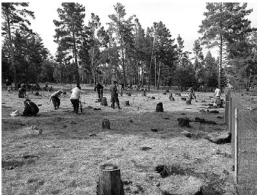
家畜食害防止柵をつくり植樹