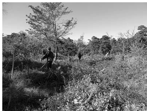
刈払機による刈払い作業