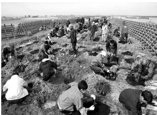
タブノキ、カシワ、トベラなどを植樹