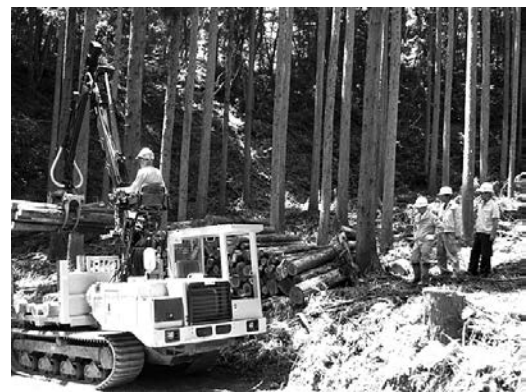
林地に残された間伐材を運び出す