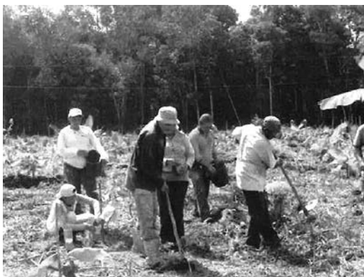
アグロフォレストリー植林