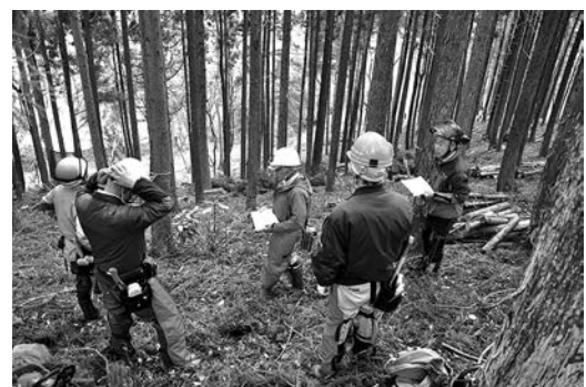
安全で効率的な作業を進めたい