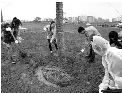
サクラ、クスノキなどを植樹