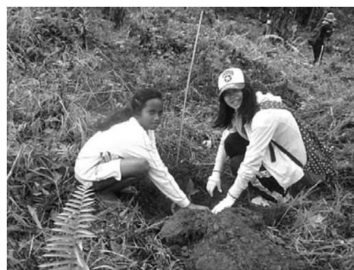
日本人ボランティアと現地の子どもが共に植林