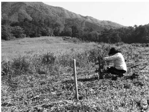
ブナやトチを植樹