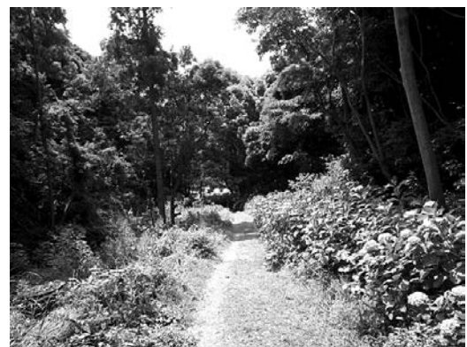
道路脇にヤマザクラやアジサイなどを植樹