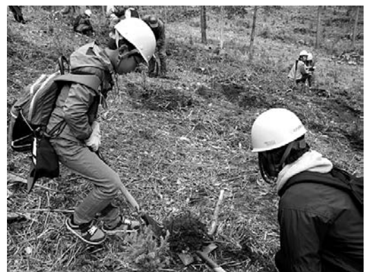
アカエゾマツの植樹