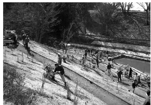
ナンキンハゼ、シャクナゲなどを植樹