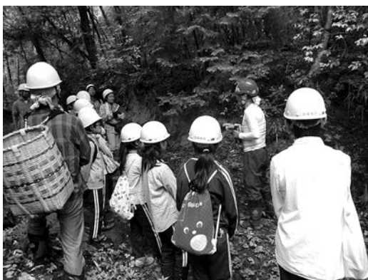
子どもの森の健康診断