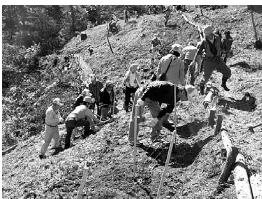
クヌギ、カンワなどを植樹