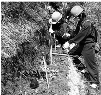
積苗工の段に植樹する地元高校生