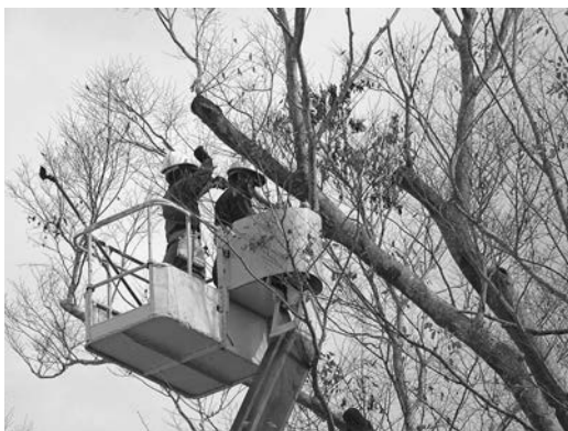
ケヤキの樹勢回復作業