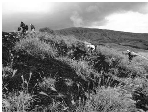
タブノキ、ヒサカキを植樹