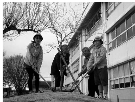
校舎前に記念植樹