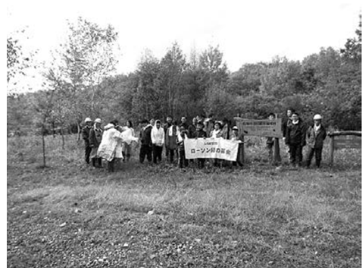
郷土樹種の再生をめざして