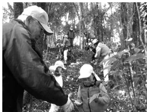
子どもたちの森林体験