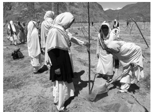
ポプラ、オリーブなどを植樹