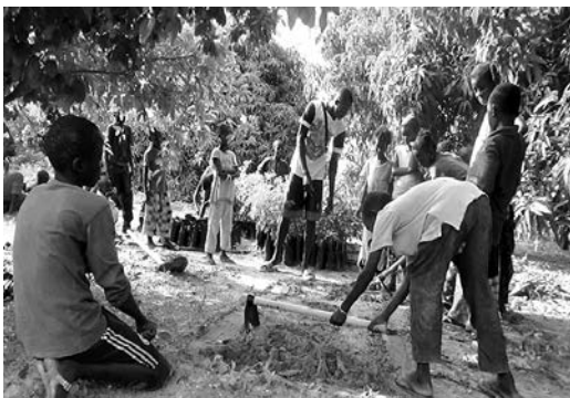
アフリカンマホガニーほかを植樹