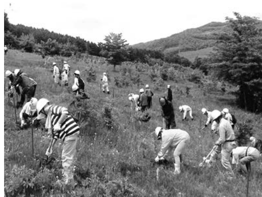
サクラ・クリ・コナラなどを植樹