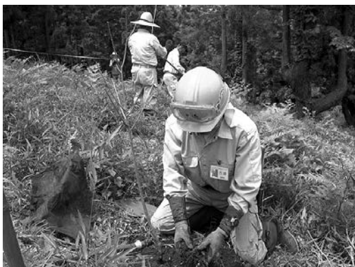
ヒガンザクラなどの植樹