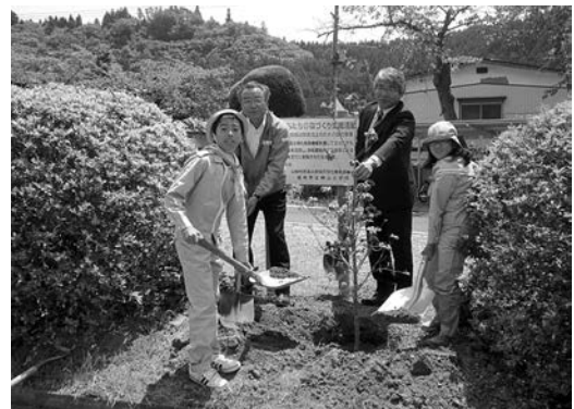
ハナミズキを植樹